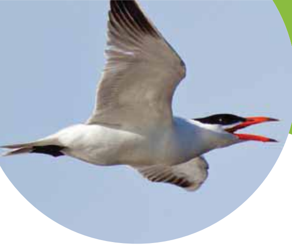
Reuzenster op steeds meer plaatsen gezien. Meers (Li), 30 april 2012.