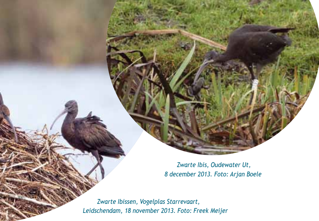
Zwarte Ibis, Oudewater Ut, 8 december 2013.