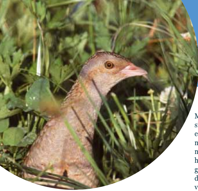
Kwartelkoningen zijn schaars dit jaar.

Met de resultaten van de eerste landelijke simultaantelling begin juni op zak kan een eerste balans worden opgemaakt van het nieuwe Kwartelkoningseizoen. En die is niet om over te juichen. Tot eind juni zijn in het hele land ca. 80 roepende vogels vastgesteld. Hoewel dat aantal in de loop van de zomer nog kan toenemen door vogels die voor een tweede broedsel gaan, verwachten we niet dat het aantal heel ver over de 100 roepende mannetjes gaat komen. De grootste aantallen (tot eind juni 24 vogels) zitten in het Groningse Oldambt. Opvallend schaars is de soort daarentegen in de uiterwaarden van de Grote Rivieren.