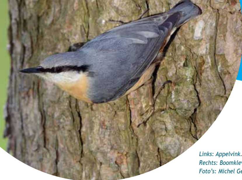
Links: Appelvink. Rechts: Boomklever

kaarten eens met die van de eerste Atlas van de Nederlandse Broedvogels (1979). Wat is er veel in veertig jaar veranderd! Drenthe, Friesland en Groningen waren toen nauwelijks bezet en in Noord-Brabant nestelde de Boomklever alleen heel lokaal. Ook sinds de eeuwwisseling is er nog heel wat gewijzigd in de verspreiding: in Zuid- en Noord-Holland is het aantal bezette atlasblokken flink toegenomen en Flevoland is verder gekoloniseerd. Zullen ook de Waddeneilanden binnen het bereik komen? De uitbreiding zal een steun in de rug heb-