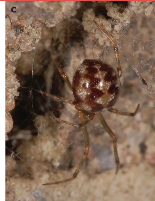
(a) Valse weduwe.; (b) Reuzensteatoda (rechts het vrouwtje).; (c) Huissteatoda.

De reuzensteatoda ( S. nobilis ) is in 2012 voor Nederland ontdekt en laat ook een gestage opmars zien met inmiddels vondsten uit acht provincies. Deze spin wordt zowel buiten in rommelige, verstoorde gebieden gezien als in gebouwen. Het is een grote spin, met een maximale lichaamslengte van 14 mm. Op het achterlichaam staat een vierkante lichte tekening met een punt aan de voorzijde en meestal lijntjes die naar de zijkanten lopen.