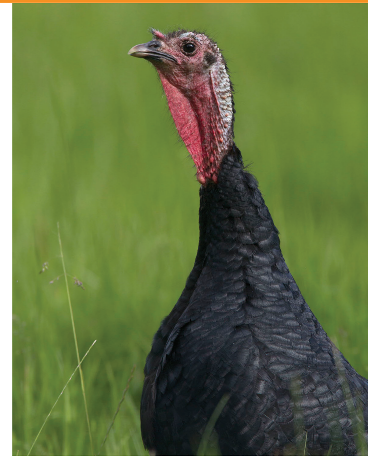
Verwilderde kalkoen.

https://www.sovon.nl/tellen/telprojecten/meldingen-zeldzame-broedvogels