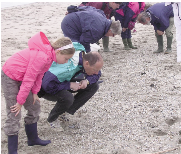
Afb. 7. Zoeken in aanspoelsel.