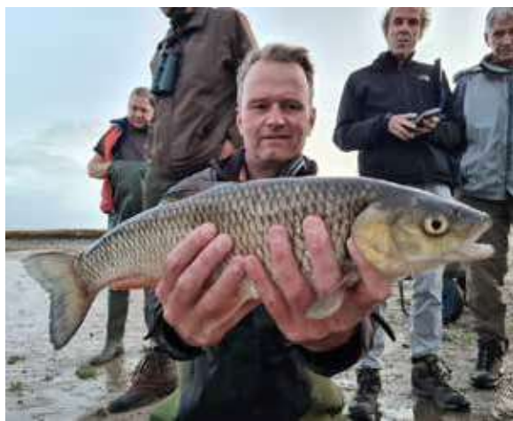
Onverwachte vangst van een grote kopvoorn in de Waal.

Het jaar 2022 was een erg droog jaar met zeer lage waterstanden. Dit jaar zullen op dezelfde locaties tussen juli en oktober opnieuw zegenvisexcursies georganiseerd worden om een vergelijking