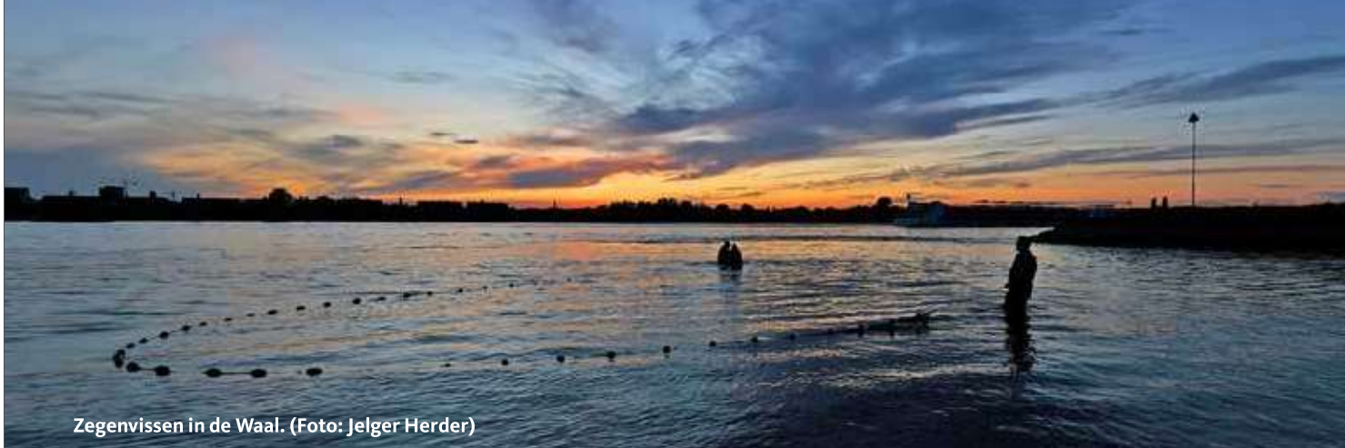
Zegenvissen in de Waal.

In 2022 zijn er in het kader van het “5000-soorten jaar Gelderse Poort” visinventarisaties met een kleine zegen (sleepnet) uitgevoerd. Het doel van het “5000-soorten jaar” was om zoveel mogelijk dier- en plantsoorten in kaart te brengen binnen één jaar in de Gelderse Poort. Naast de Gelderse poort (Waal, Nederrijn & Pannerdensch kanaal) werd er ook gevist in de Loonse Waard (aantakking Maas).