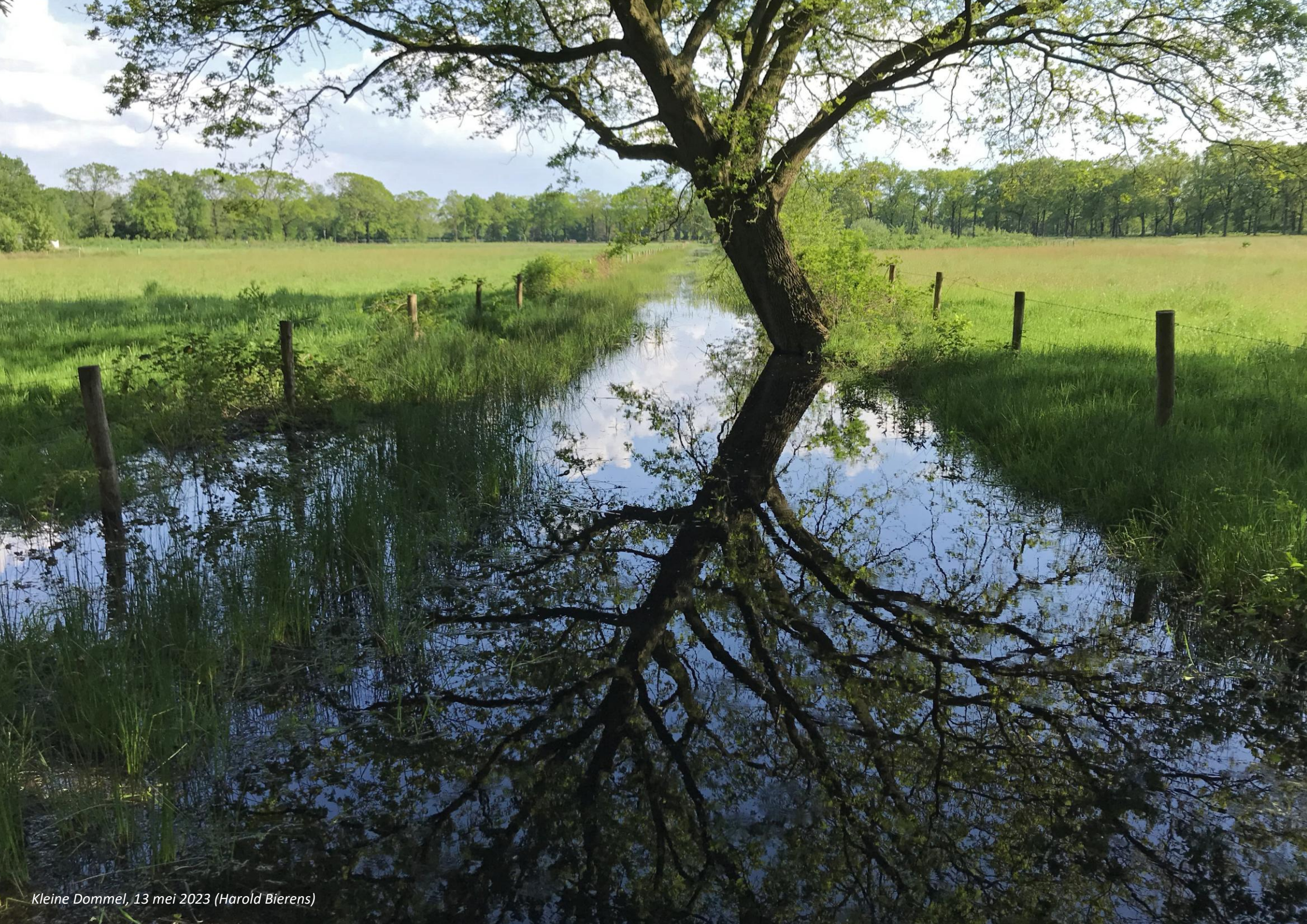
Kleine Dommel, 13 mei 2023 (Harold Bierens)