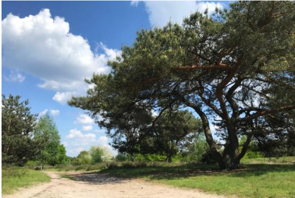
Stratumse Heide, 13 mei 2023 (HB)

stil, maar ik hoor bij een open plek de hoge piepjes van Grauwe Vliegenvanger die zich goed laten bekijken. Vooral veel Vinken maar ook Zwarte Mees en Kuifmees. Geen Goudhaantjes, en dat ligt niet aan mijn gehoor. Verderop de eerste Boompiepers. Ik ken de weg niet en dwaal op goed geluk door het bos.