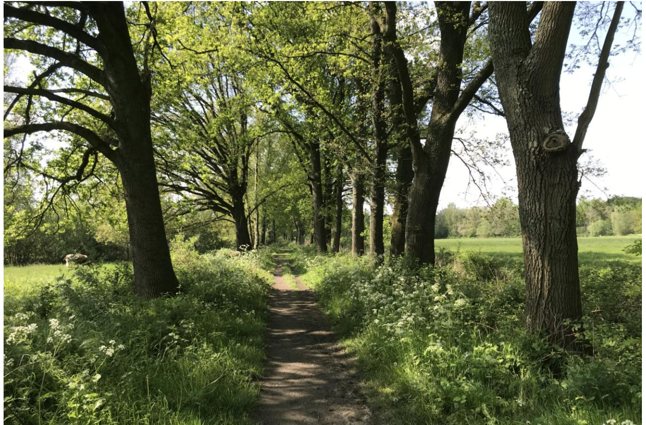
Gijzenrooi, 13 mei 2023 (HB)

wel een fijne aanvulling. Natuurlijk Fitis, weer Boompiepers en nog een Gekraagde Roodstaart. Geen Fluiter, waarvoor ik een stuk met wat jonge eiken wel geschikt acht. Een veldje met een mooie poel is wel goed voor de eerste en enige Torenvalk.