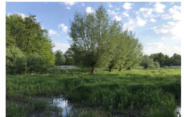
Dommelmoeras, 13 mei 2023 (HB)

De wekker gaat om 6 uur: uitslapen voor inventariseerders. Eerder is niet nodig, vorig jaar begonnen we om 4.15u en naast een Zwarte roodstaart in het centrum en veel dronken stappubliek leverde dat weinig voordeel op. Na een snel ontbijt kan ik zo de fiets op en naar mijn 'home patch' in. Het Dommelplantsoen waar Tongelreep en Dommel samenkomen is een fraai stukje jungle middenin in de stad. Ik kom hier vaak maar dit valt ook in mijn MUS-gebied.