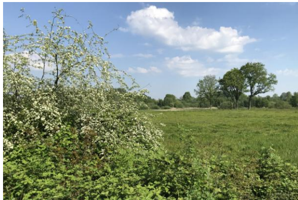
Klotputten, 13 mei 2023 (HB)

Knobbelzwaan en in de verte een lege Oeverzwaluwwand. Het vele riet is wel goed voor karekieten en een eerste Rietgors. Maar de zon schijnt, het is intussen behoorlijk warm, dus speur ik op mijn gemak wat rond. Een Zwarte Roodstaart zingt vanaf de hoogbouw, een Gekraagde even later bij een oude boerderij op het terrein. Een vrouw Sperwer vliegt over met prooi, maar ik kan er niets van maken voor de soortenlijst. Een Slechtvalk zeilt boven het Philipspand. Een nieuwe nestplek? Mooi, hoef ik daarvoor de stad niet in. Over vlonders fiets ik naar de oeverzwaluwwand. Wel wat graafsporen, maar dat telt niet.