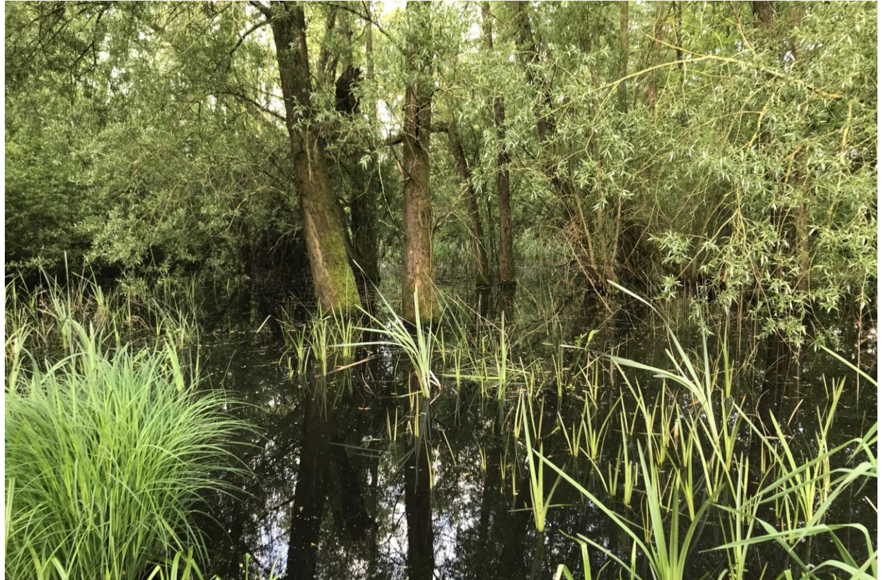
Moerasbos, 13 mei 2023 (HB)

Ik steek intussen door naar het Stadswandelpark. Statige, oude bomen met verschillende vijvers. Goed voor wat algemene watervogels al zijn dat hier ook vooral de exoten Nijl- en Canadese Gans. Mét jongen, en dat zal ik nog vaak zien vandaag. Wilde Eenden met pullen zie ik niet of nauwelijks en dat past misschien ook bij het beeld dat het met die soort minder gaat. Naast de verwachte zangvogels is het park ook een bekende plek voor de Middelste Bonte Specht. Ik speel het geluid een paar