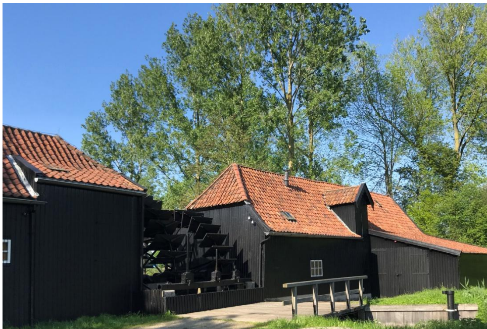
Collse molen, 13 mei 2023

Bij de Collse Molen is het rustig. Geen wandelaars of vissers. Wandelen door het