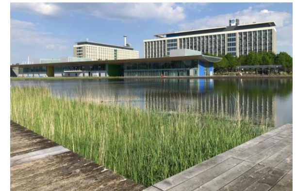
The Strip op de High Tech Campus, 13 mei 2023

yogastudio, hopen dat de 'juf' me niet ziet nu ik mij afgemeld heb. Bonte Vliegenvangers en Groenlingen die ik ooit vanuit de studio hoor, laten zich nu ook horen. In de paardenwei zitten veel Spreeuwen en in een deel wat vaak 'blank' staat zitten nu 3 Kleine Mantels. De houtwallen en braamkoepels zijn potentieel geschikt voor de Grauwe Klauwier. Twee jaar geleden toen we de Kempen op de soort onderzochten heb ik dit ook intensief afgespeurd. Er wordt hier toch te druk gecreëerd, is mijn idee. Misschien later ooit. Hoewel nat en ongemaaid, zitten er wéér geen Kieviten in het weilandje. Vorig jaar dus ook niet en dit is het enige bekende gebied voor mij.