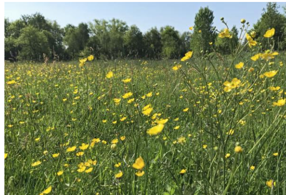
Veld vol boterbloemen, 13 mei 2023 (HB)

Er zitten wel twee Grote gele kwikken bij de sluis in de Dommel. Het landschap is fraai, een veld vol boterbloemen en de nodige libellen zorgen voor wat oponthoud.