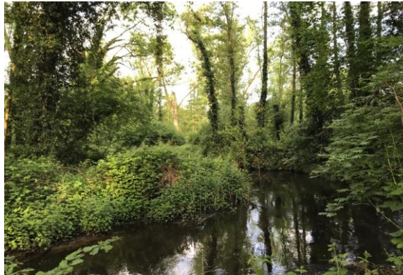
Tongelreepmoeras, 13 mei 2023 (HB)

heerlijk nat en voor de mountainbike nog lastig.