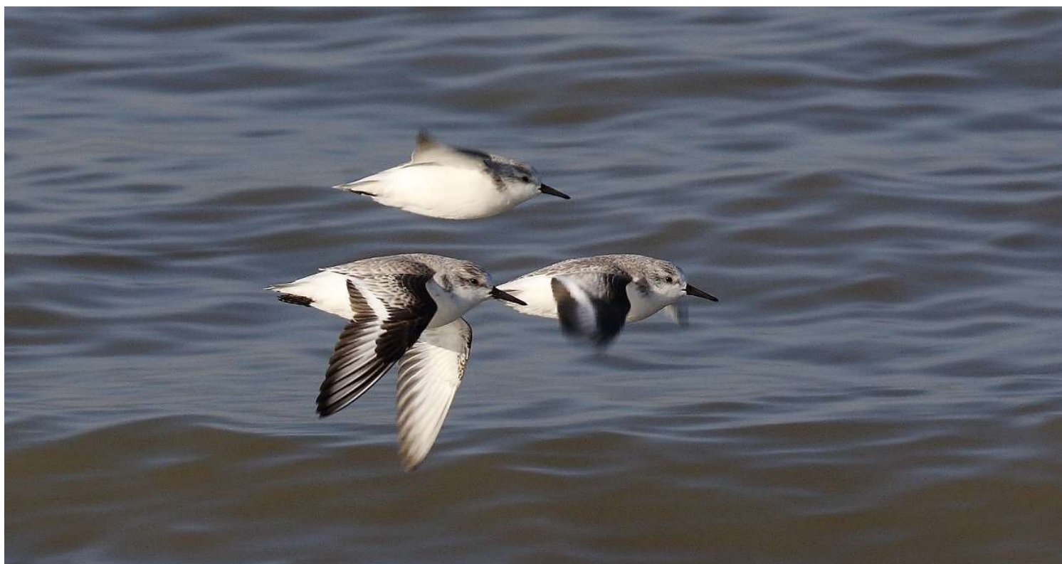
Verdwijnt de Drieteenstrandloper van het Noordwijkse strand? 26-1-2010

Eind vorige eeuw startte ik met het tellen van de vogels op het Noordwijkse strand. Voor de meeste vogelaars geen uitdaging met al die Zilvermeeuwen en honden, maar wel voor mij. Inderdaad het zijn vooral Zilvermeeuwen, maar ook veel onverwachte ontmoetingen. Meestal vliegen de