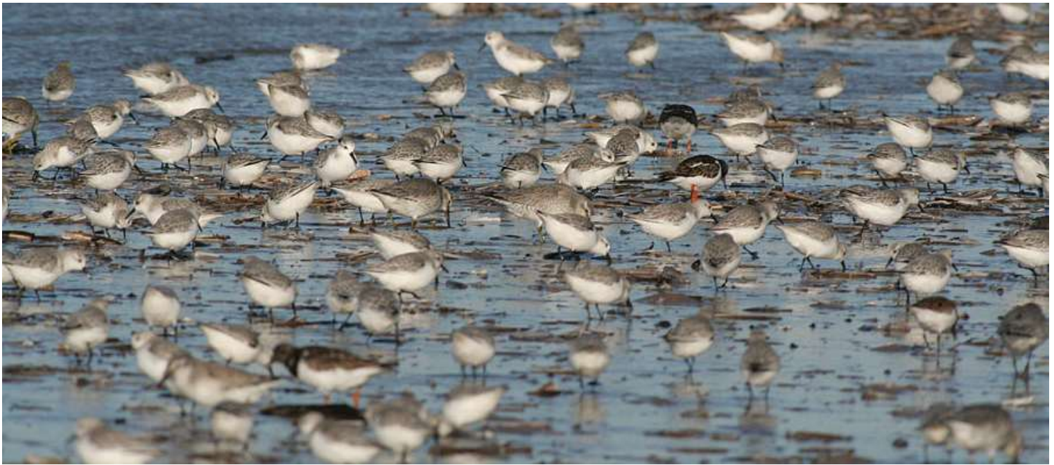
Volop foeragerende Drieteenstrandlopers met enkele Steenlopers op het Noordwijkse strand. 29-1-2006