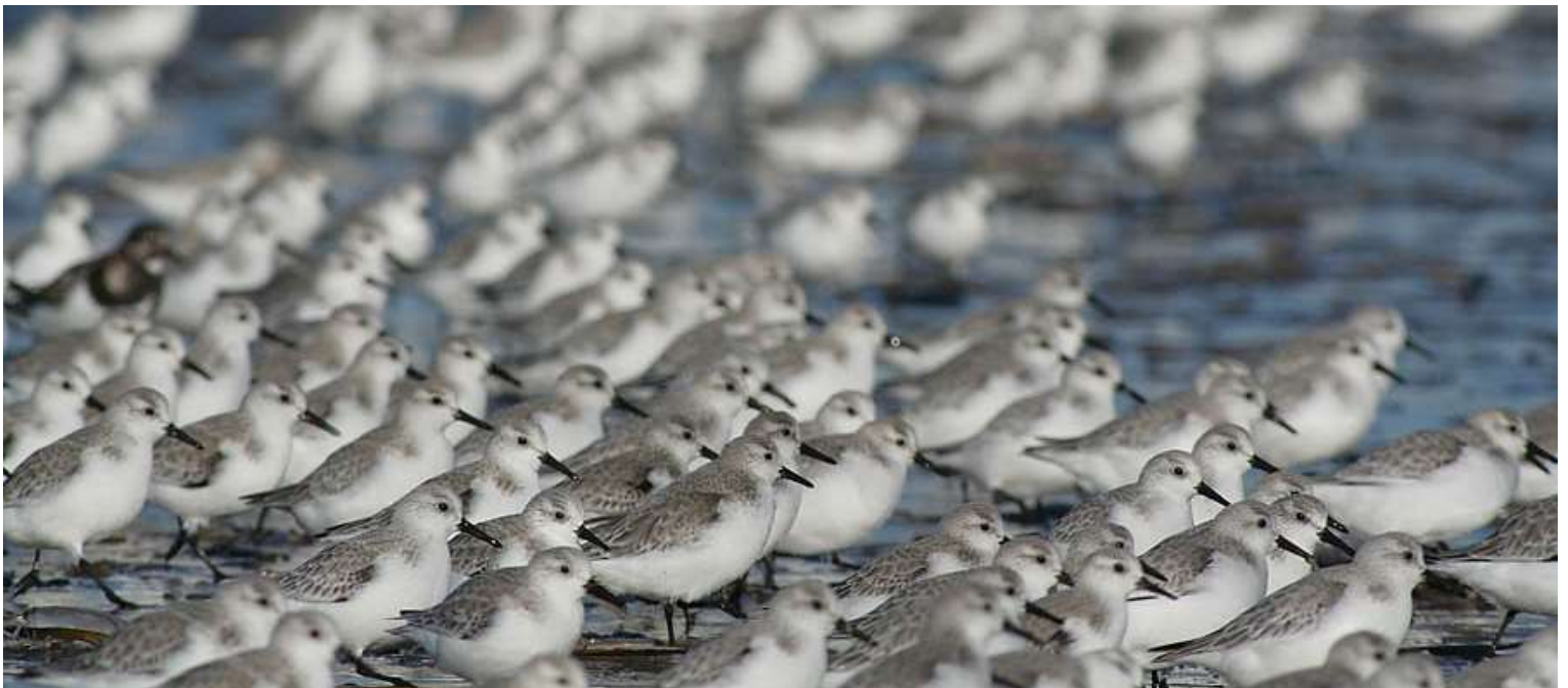
Vele honderden drieteentjes op het Noordwijkse strand op 29 januari 2006.

Gedurende de eerste vijf teljaren zaten er gemiddeld 400 tot 600 Drieteenstrandlopers op het Noordwijkse strand in de periode november tot en met maart. Bij sommige tellingen werden meer dan 1000 strandlopertjes genoteerd! Daarna zakte het gemiddelde aantal plotseling tot onder de 200 vogels in de winter van 2009. Voorzichtig krabbelde dit weer op tot bijna 400 in 2015 (fig.1). Maar daarna is het compleet misgegaan. Vanaf 2020 werden er gemiddeld minder dan 150 waargenomen en afgelopen winter liep er vrijwel geen drieteen meer op het Noordwijkse strand. Maar deze sterke achteruitgang past allerminst in de algemene populatieontwikkeling van de soort. In het Sovon-overzicht van de watervogels in Nederland 2019/2020 begint de soorttekst van de Drieteenstrandloper als volgt: “Aan de toename van de Drieteenstrandloper in de Zoute Rijkswateren van Nederland lijkt maar geen einde te komen” (fig. 2). De ontwikkeling in Noordwijk is precies tegenovergesteld. Wat is hier aan de hand?