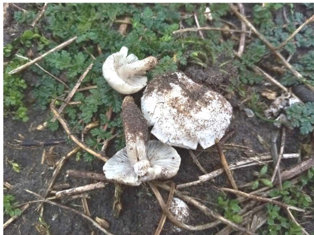
Blanke pronkridder - Foto: Edwin Maassen

Zo zie je maar weer: paddenstoelen zijn nooit saai en bieden elk jaar weer verrassingen.