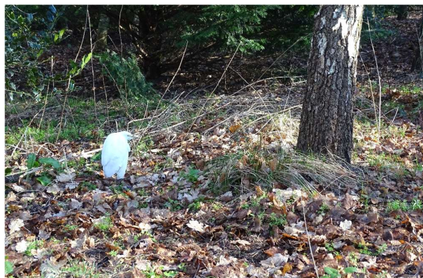
Koereiger met hangende vleugels in het bos. Het einde nadert. 2 maart 2023

Het leek de Koereiger goed toeven in het Noordwijkse. Maar op 2 maart stuitte ik op het reigertje tijdens een live-atlating in Offem. De vogel zat ineengedoken in de groenstrook met Hulst en Els aan het eind van de Varkensboslaan achter landgoed Offem, tegen de N206. Pas toen ik hem tot op een meter benaderde, vloog hij moeizaam enkele meters verder. Dat zag er niet goed uit. Dus na de koffie weer even poolshoogte genomen en wat ik al verwachtte, was gebeurd. De vogel lag dood vlakbij de plek waar hij enkele uren eerder zat (figuur 1). Hij was dus vers dood en puntgaaf, een goede reden om hem mee naar huis te nemen en in de vriezer te leggen.