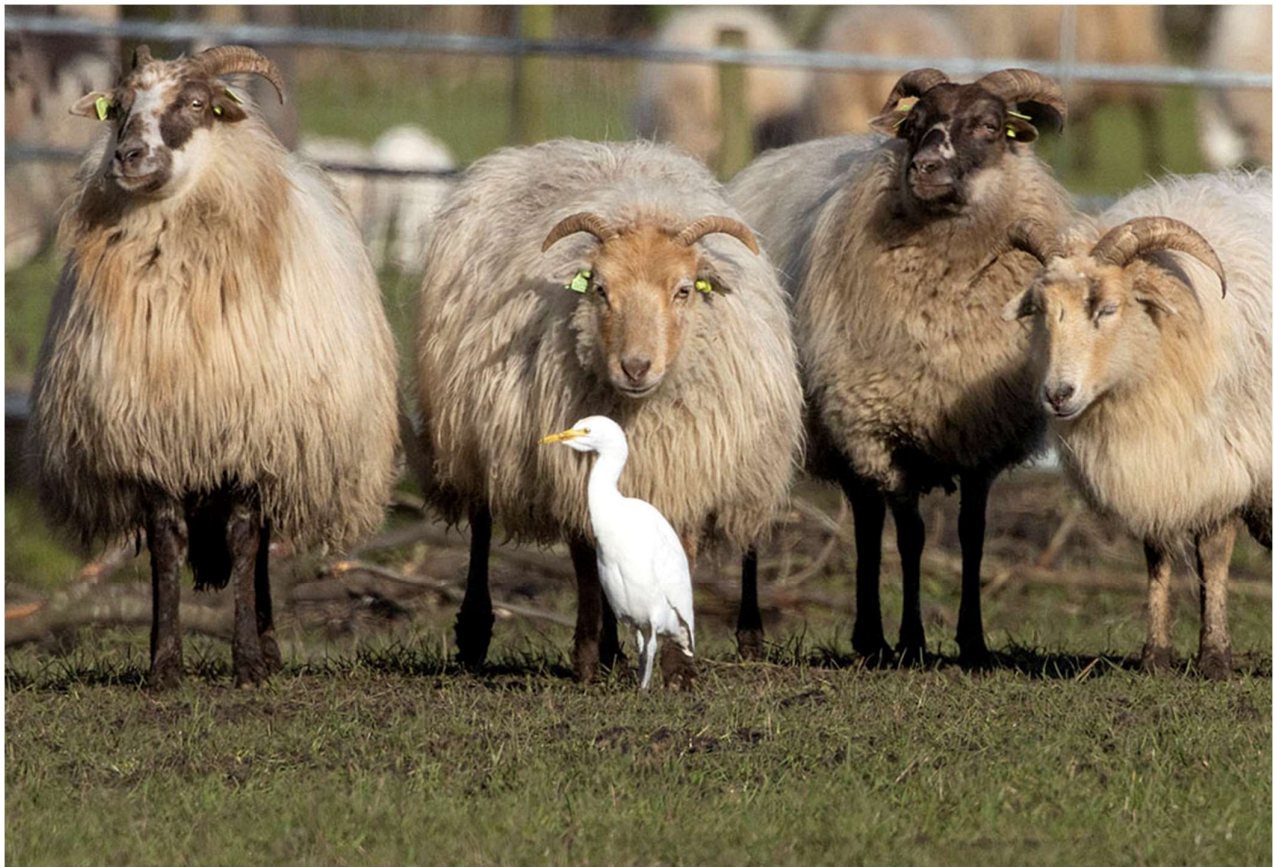
Koereiger tussen de schapen langs de Varkensboslaan – foto: Jan Hendriks