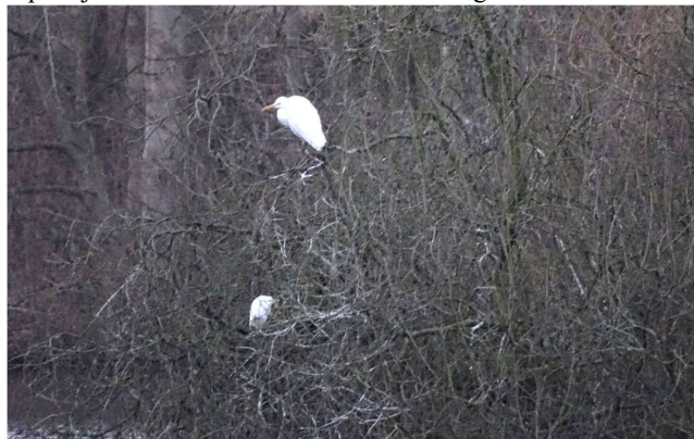
Grote Vijver Nieuw-Leeuwenhorst. Slaapplaats met Grote Zilverreiger boven en Koereiger onder. 24 februari 2023 - Foto Hein Verkade.

Sinds 2009 volg ik de slaapplaats van Aalscholvers en Grote Zilverreigers langs de Grote Vijver van Nieuw-Leeuwenhorst. Op 11 januari streek er een kleine witte reiger neer tussen de