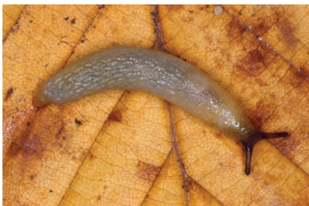
▼ FIGUUR 8 De Egel-wegslak ( Arion intermedius , lengte tot 2,5 cm) is een naaktslak die herkend kan worden aan de uitstekende huidtuberkels, die zich hier op het lijf aftekenen als langge-rekte ovaaltjes.

revue passeren: de Bron-blaashoren ( Physa fontinalis ) vanwege zijn bijzondere huisje en de Geronde schijfhoren ( Anisus leucostoma ) omdat hij perioden van droogte kan overleven.