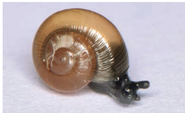
◀ FIGUUR 7 Het Ammonshorentje ( Perpolita hammonis ; diameter tot 4,2 mm) heeft een voorkeur voor enigszins zure milieus.