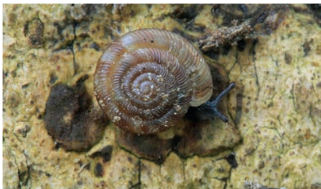
▲ FIGUUR 6 Het Boerenknoopje ( Discus rotundatus ; diameter tot 6,5 mm) kan in vrijwel alle typen bos onder valhout worden gevonden.

Weekdieren van het Vlootbeekdal op de (deels geclusterde) locaties. De coördinaten geven de onderzochte plekken bij benadering aan [zie ook figuur 4]. De bodem van de Vlootbeek is incidenteel bemonsterd tussen het Munnichsbos en Landgoed Rozendaal.