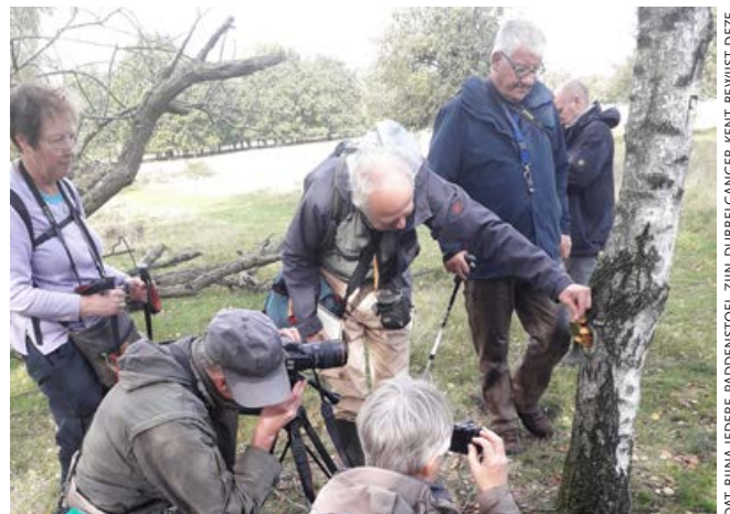
DAT BIJNA IEDERE PADDENSTOEL ZIJN DUBBELGANGER KENT BEWIJST DEZE DUBBELGANGERDUBBELZWAM (PHOLIOTA LIMONELLA)

De Plantenstudiegroep organiseerde tussen april en half oktober bijna wekelijks een streepexcursie in Zuid-Limburg. De streepexcursies dit jaar stonden in het teken van de 'witte