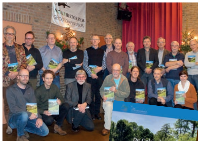
AUTEURS BOEK DE GELEENBEEK

Bij de Stichting Natuurpublicaties Limburg verscheen het boek 'De Geleenbeek. Beleef de natuur in verandering'. Dit boek, geschreven onder redactie van Pierre Grooten, Stef Keulen, Reinier Akkermans en Olaf Op den Kamp, beschrijft de natuurgebieden langs de Geleenbeek. De 25 auteurs gaan in dit boek in op de daarin voorkomende flora en fauna en andere bijzonderheden.