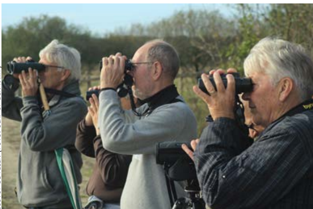
ECOTOP DE PELEN