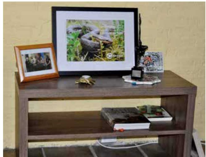
Beeldje en oorkonde hebben een ereplek in huis.