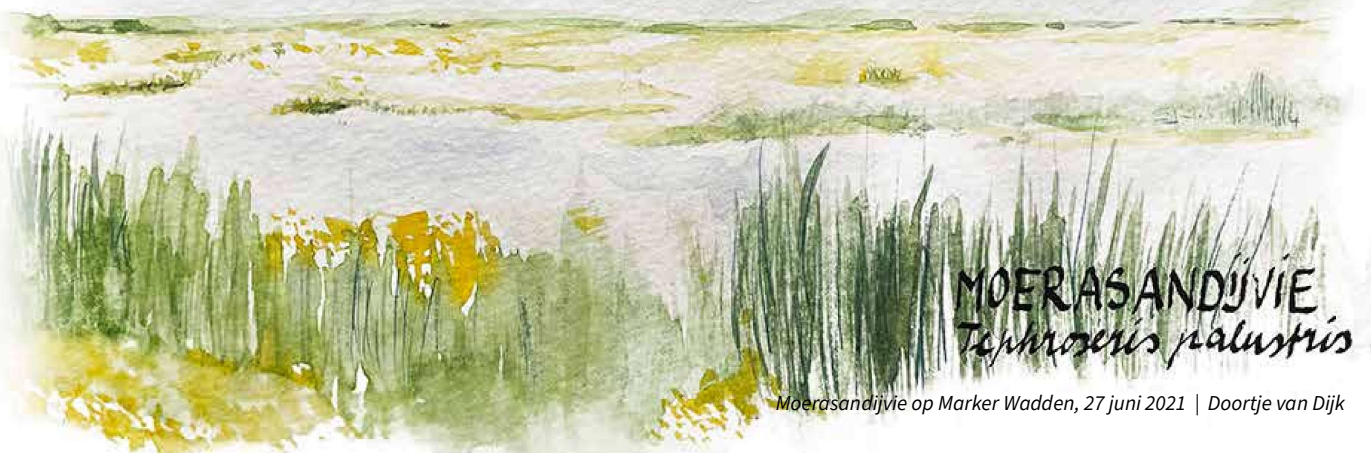
Moerasandijvie op Marker Wadden, 27 juni 2021 | Doortje van Dijk