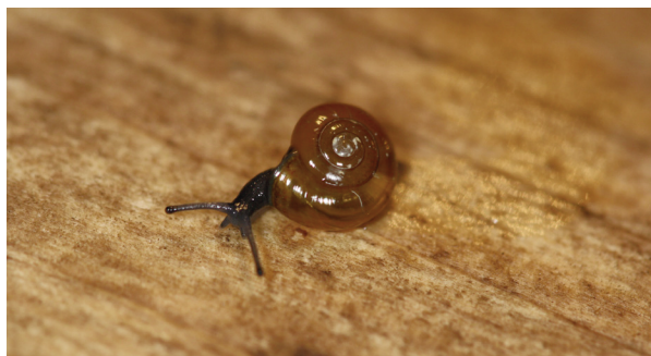
Fig. 1. De Look-glansslak ( Oxychilus alliarius ).

De Look-glansslak, Oxychilus alliarius (J.S. Miller, 1822) is de kleinste vertegenwoordiger van de familie van de Glansslakken (Oxychilidae) in Nederland; de breedte van een volgroeid huisje is 7 tot 10 mm. Het huisje is laag kegelvormig en heeft ongeveer vijf vrijwel vlakke omgangen. Het huisje is donker hoornbruin met soms een zweem naar roodbruin aan de bovenzijde; aan de onderzijde wordt het naar de navel toe bleker. Het huisje is doorsichtig, glad en glanzend, met fijne radiale groeilijnen. Lege huisjes worden in de natuur al snel ondoorzichtig. De slak is aan de bovenzijde donkergrijs, bijna zwart; naar de onderzijde gaat de kleur over in lichtgrijs.