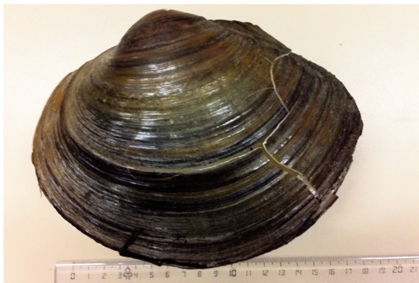
Fig. 1. Chinese vijvermossel Sinanodonta woodiana (doublet) uit open water in Reeshof (Tilburg).

zoetwatermossel was op 27 mei 2011 gevonden door Remie van Someren, Sander van Wanrooy en Emiel Wagemakers uit groep 6 van basisschool Meander, tijdens een veldwerkactiviteit van het Natuurmuseum Brabant in de Dongevallei, in de wijk Reeshof te Tilburg (Amersfoort coördinaten 126.96-400.40). Het doublet werd aangetroffen in een van de vijvers van de wijk die in verbinding staat met het riviertje de Donge. Ter plaatse zijn grote Gewone karpers ( Cyprinus carpio ) waargenomen en in de Donge zelf worden regelmatig Goudkarpers ( Cyprinus spec. ) gesignaleerd, die daar hoogstwaarschijnlijk zijn losgelaten door hun eigenaar (mondelinge mededeling Hans Joosten).