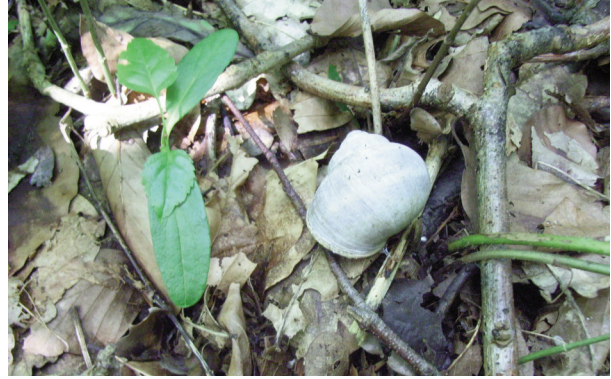
Fig. 4. en op de grond.