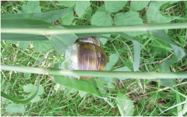
Fig. 3. Op een rietstengel,