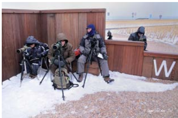
Zeetrektellen