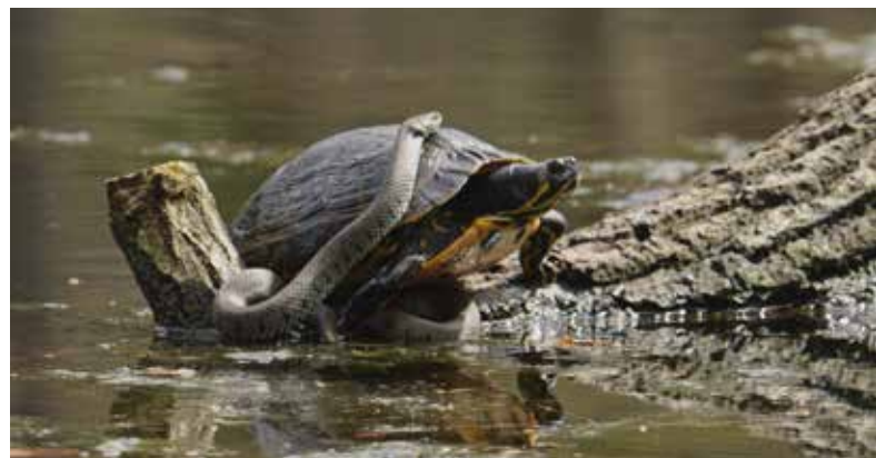
Twee ringslangen samen met een geelbuikschildpad aan het zonnen.