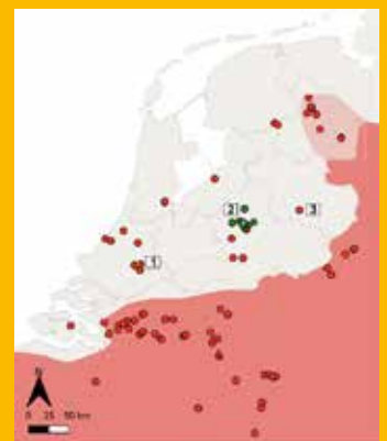
Figuur 1. Verspreidingskaart Alpenwatersalamander. Achtergrondkleur weerspiegelt de natuurlijke verspreiding van de mtDNA-clades en symbolen weerspiegelen de bemonsterde locaties. De inzet toont Nederland in meer detail (lichtere arcering weerspiegelt onzekerheid over de status van de populatie in het noordoosten van het land). De nummers verwijzen naar plaatsen/regio's genoemd in het artikel: 1=Oudeland, 2=Veluwe en 3=Holterberg.

De Alpenwatersalamander is een apart geval. Waarschijnlijk gaat het niet om een enkele soort, maar om een verzameling van soorten, die qua uiterlijk erg op elkaar lijken. Op het oog zijn ze dus moeilijk te onderscheiden, maar genetisch gezien zijn deze zogenaamde cryptische soorten superverschillend. De nieuwe DNA-resultaten tonen aan dat maar liefst drie van de vijf cryptische Alpenwatersalamandersoorten in Nederland