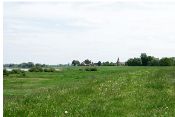
Uitzicht op Schnackenburg, 18 mei 2023 (RA)

Als teleurgestelde Draufgänger fietsen we terug langs de Elbe richting Gartow. Overigens een mooie route langs kwel, rivierbossen en moerasjes met Grauwe Klauwier, Paapje, Gele Kwik, Zeearend, Grauwe Gors, Spotvogel, Cetti's Zanger en Buidelmees en tevens het lieflijke geluid van talloze Roodbuikvuurpadden. De langs een poeltje aanwezige Poelruiter blijkt geen grap, maar wel een zeldzaamheid. Tot de gewone soortenpoel behoren ook de alomtegenwoordige Nachtegalen en Wielewalen. De schitterende natuur zuigt onze teleurstelling op en we praten onderwijl nog wat na over de man van Drüben en herkennen hem zeker niet als personificatie van het spannende boek Spion unter Spitzeln of de film Das Leben der Andern , beide handelend over het leven in de DDR.