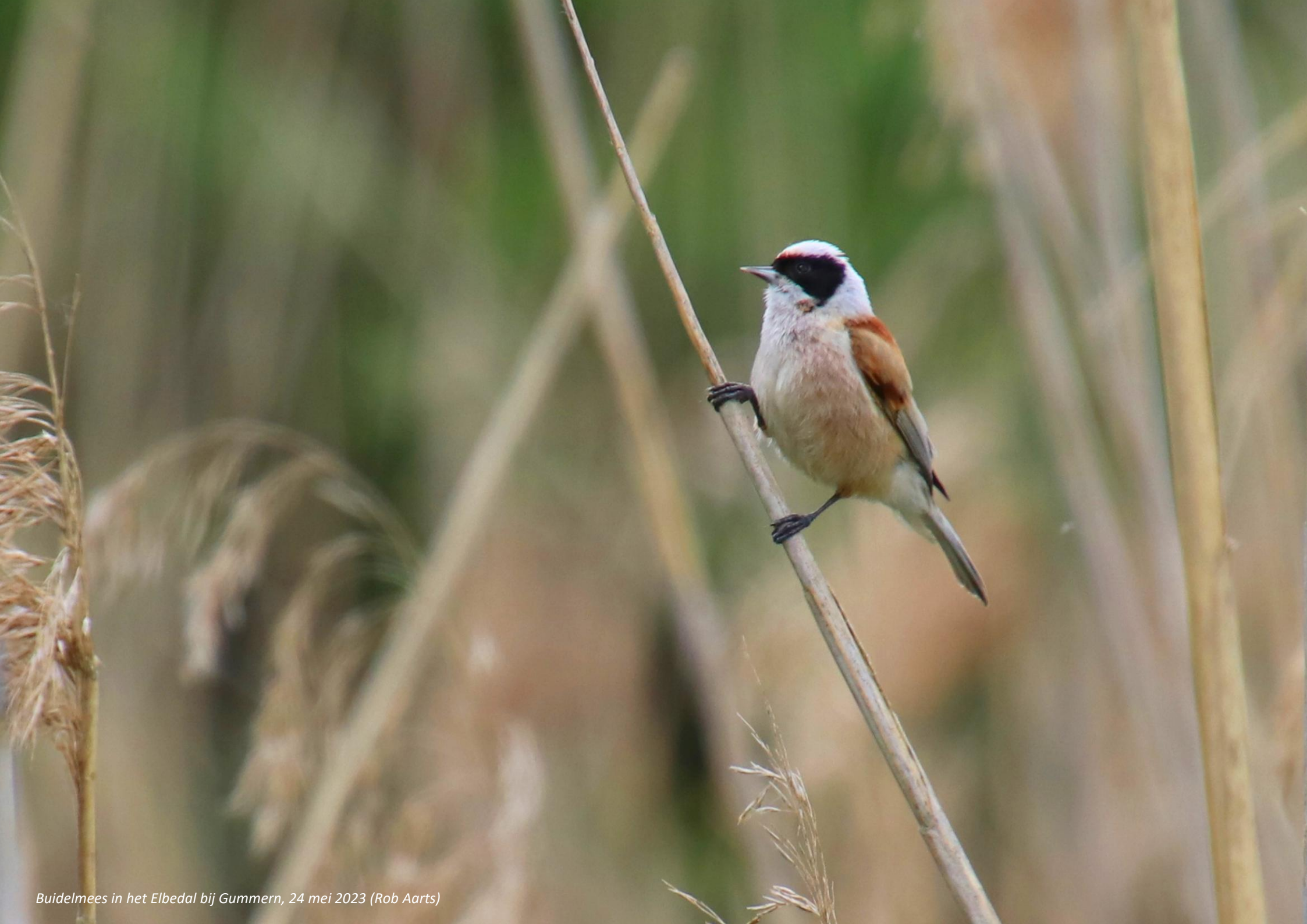
Buidelmees in het Elbedal bij Gummern, 24 mei 2023 (Rob Aarts)