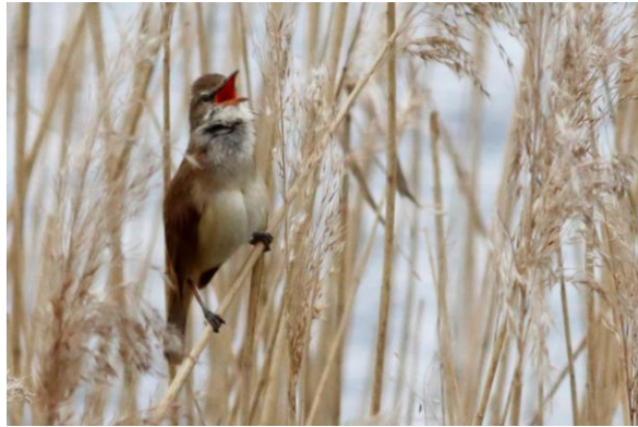
Grote Karekiet aan de Gartower See, 21 mei 2023 (RA)

verjaagd. Hetzelfde verschijnsel zagen we eerder aan het Lac du Der in Frankrijk.