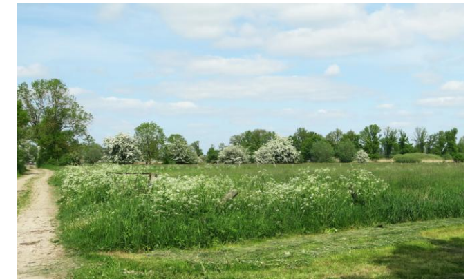
Overal bloeiende meidoorns, 18 mei 2023 (RA)

dag blijkt al een openbaring met roepende Kraanvogels en jagende Zeearenden. Campingplatz Gartow als benaming voor de lokale camping getuigt niet echt van creativiteit. Kranichplatz zou de kwaliteit van de omgeving meer recht doen. Een tweede camping is Camping Laascher See. Deze camping is wat dieper in de natuur gelegen en bezit, niet onbelangrijk, een terras. Details zijn te vinden op internet.