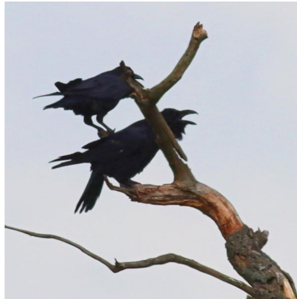
Raven bij Seegeniederung, 20 mei 2023 (RA)

baltsende Watersnippen, Kwartelkoning, baltsende Raven, Wespendif, Spotvogel, Rietzanger, Kleine Karekiet, Blauwborst, Sprinkhaanzanger, Grauwe Gors, Wielewaal en Zeearenden op dertig meter en het alomtegenwoordige roepen van Kraanvogels, die broeden in kleinere moerassen.