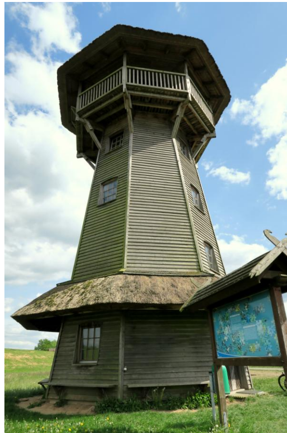
Klaus-Bahlsen-Turm bij Gartow, 19 mei 2023 (RA)

zien we deze soorten overigens slechts sporadisch verschijnen. Dat geldt ook voor de Krekelzanger. Mogelijk zijn we aan de late kant in het voorjaar.