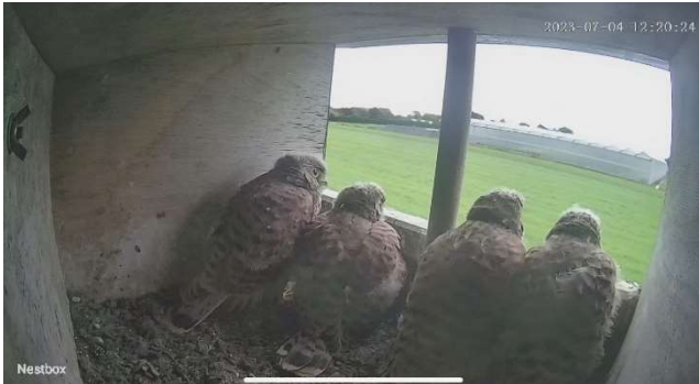
Vier weken oud

voordat de ringer ze kan pakken. Dan komen ze in een brede sloot terecht en dat moeten we voorkómen. Voor de zekerheid zorgen we voor een schepnet, zodat de opening van de kast afgedekt is bij het eruit halen van de jongen. Dat blijkt geen overbodige maatregel: een van de jongen belandt in het schepnet en gelukkig niet in de sloot. Het blijken vier mannetjes te zijn, allemaal met een gewicht van ca. 235 gram.