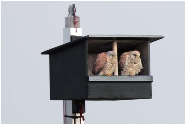
Man (links) en vrouw in de kast.

Sinds we in 2020 op het Westeinde zijn gaan wonen, broeden er voor het derde seizoen Torenvalken in de kast in onze tuin. Omdat er sinds vorig jaar een camera in de kast is geplaatst, kunnen we de verrichtingen van het paar Torenvalken nauwgezet volgen. In de maanden augustus tot februari is het rustig en zien we beide vogels af en toe individueel op de camera. Ze zijn in de winter niet zuidwaarts getrokken. Op 13 februari zien we ze samen in de kast, ze knuffelen als tortelduiven. Hoewel ze niet geringd zijn, is het zeer waarschijnlijk dat het dezelfde vogels zijn als de vorige jaren. Opvallend is dat ze veel minder schuw zijn dan voorheen en blijkbaar gewend aan onze aanwezigheid. Ze blijven gewoon zitten als we aan komen lopen. Eenmaal landde het mannetje op een paar meter voor ons op het gras.