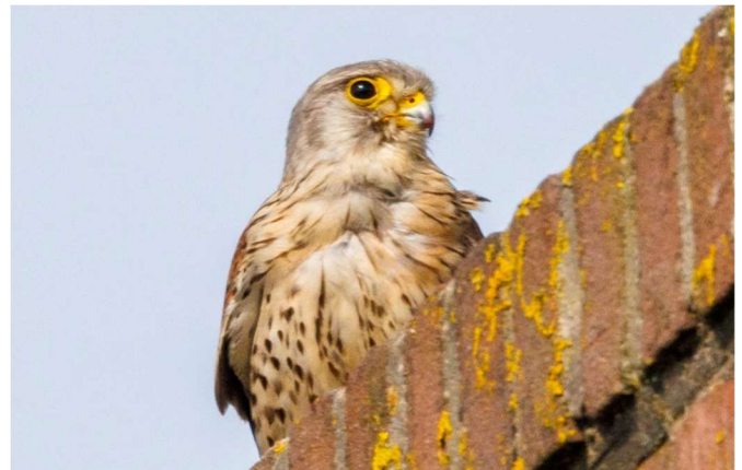
Juveniel op de schoorsteen.

Tien dagen na het uitvliegen wordt helaas een van de jongen dood gevonden, verstrikt in een afdeknet voor planten en gewassen, op 300 meter van ons huis. De vinder komt bij ons aan huis om dat te melden. Via Griel (de online database van geringde vogels) ontdekte hij waar de vogel vandaan kwam. Elk seizoen loopt het weer anders met de Torenvalken. Op naar volgend jaar!