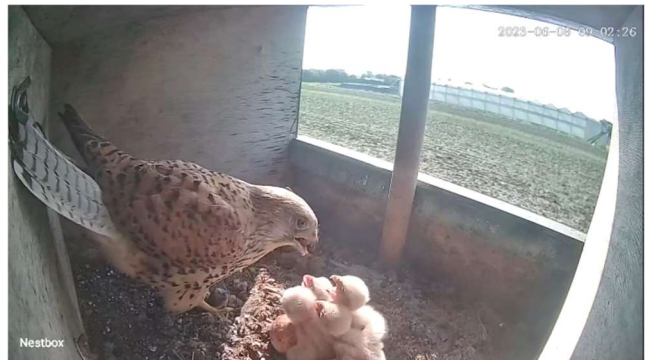
Vier jongen worden gevoerd

Op 5 juni, na 34 dagen, komt het eerste ei uit. Binnen twee dagen zien we vier jongen en een ei, dat later blijkt onbevruucht te zijn. Er breken drukke tijden aan voor het