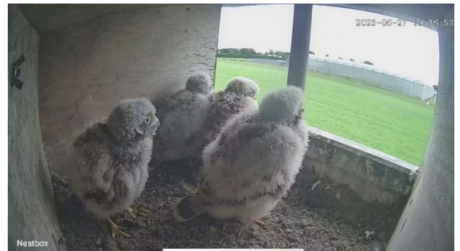
Drie weken oud

valkenpaar. Man brengt nog vaker (elke 2-3 uur) muizen. Alleen de vrouw voert en verdeelt de prooi in kleine stukjes over de vier opengesperde snaveltjes. De eerste prooi wordt al om 7 uur gebracht, de laatste rond 21 uur. Als de vrouw even de vleugels wil strekken, bewaakt de man de kast. Na het voeren verdwijnen de jongen weer onder de warme vleugels van moeder Torenvalk. Na een