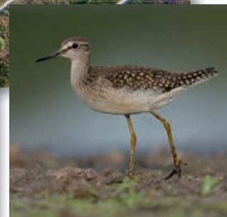
BOSRUITER (TRINGA GLAREOLA)

Deelname aan de Maasduinen-Ecotop 2023 kost slechts € 5,00 per persoon. Betalen bij registratie, op de dag zelf (alleen contant, pinnen is niet mogelijk).