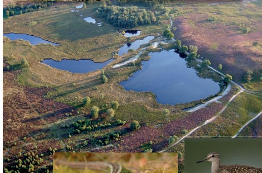
LANDGOED DE HAMERT