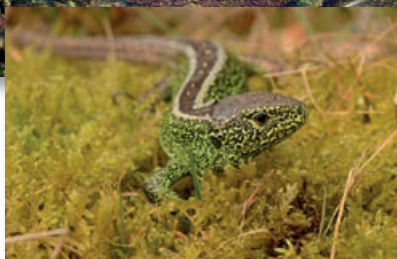
ZANDHAGEDIS (LACERTA AGILIS)