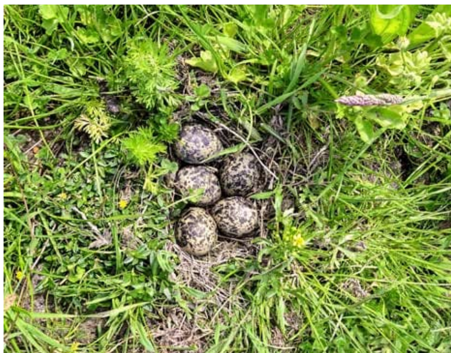
Kievitsnest met maar liefst 5 eieren

Voedsel- en Warenautoriteit) controleert de uitvoering van de maatregelen, maar ook Gert en de andere gebiedsregisseurs houden toezicht. Ook is er controle door de provincie en Sovon. De bescherming is belangrijk omdat de weidevogels in het algemeen achteruit gaan. Maar in Eemland gaat het goed