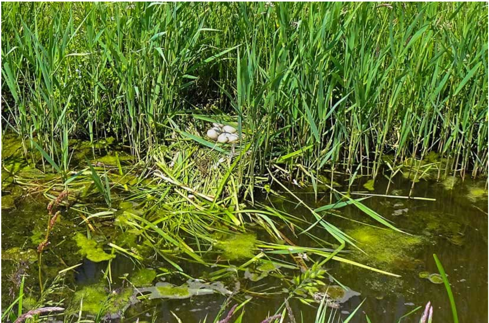
Nest Meerkoet | Hanneke Cusell

begin waren er maar drie deelnemende boeren. Maar als Gert ergens nesten zag, ging hij naar de boeren toe die dan vaak belangeloos bereid waren om er omheen te maaien. Het aantal boeren dat meedoet is zo steeds verder gegroeid.