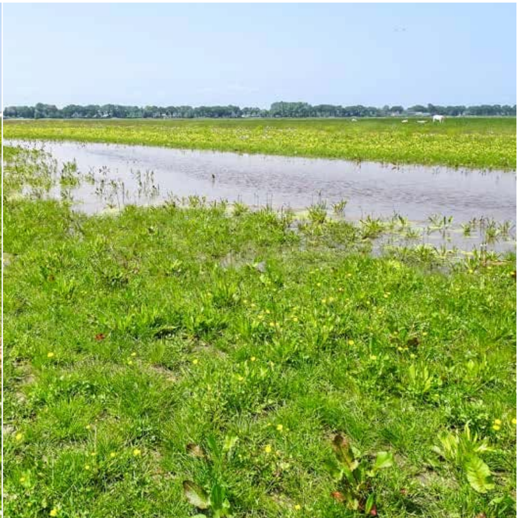
Plas-dras | Hanneke Cusell