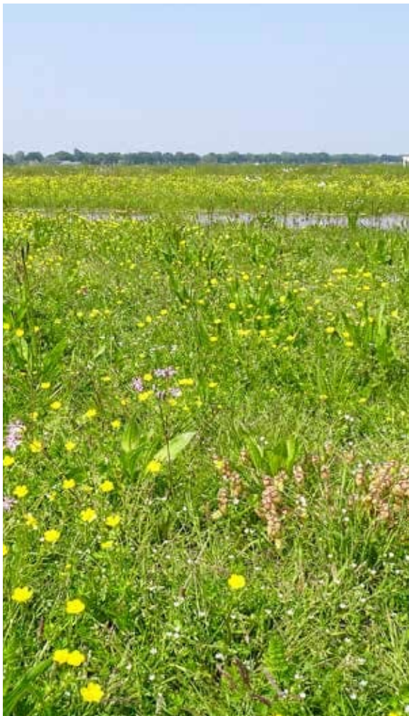
Plas-dras en kruidenrijke vegetatie