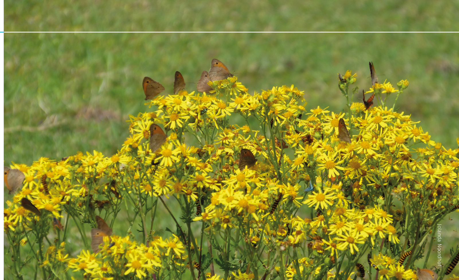
Bruin zandoogjes hebben een lagere index dan 30 jaar geleden. Het beeld van veel nu is dan ook niet meer te vergelijken met vroeger. Hoeveel telt u er op deze foto?

Kijken we naar de verdeling van de topdagen door de tijd (figuur 1) dan zien we dat de meeste vielen