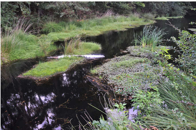
Figuur 7. Monsterpunt in de Houtvijver waar larven van Omisus caledonicus in 2020 en 2022 werden gevonden. Figure 7. Sample point from Houtvijver where larvae of Omisus caledonicus were found in 2020 and 2022.

Naast O. caledonicus werden in 2020 en 2022 nog andere dansmugsoorten verzameld (tabel 1). De ecologische karakterisering van de soorten aan de hand van Vallenduuk & Moller Pillot (2007), Moller Pillot (2009) en Moller Pillot (2013) omschrijft het monsterpunt van de Houtvijver als een plek met een zekere mate van buffering met een ruime beschikbaarheid van detritus, rottend plantenmateriaal en ondergedoken en drijvende waterplanten en met voldoende matig zuurstof-