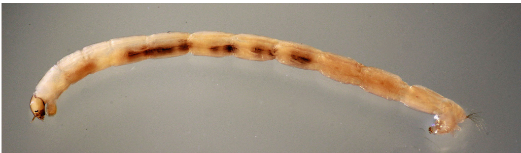
Figuur 1. Omisus caledonicus habitus. Figure 1. Omisus caledonicus habitus.

genomen. Daarbij werden de verschillende microhabitatjes van een monsterpunt bemonsterd. De monsters uit augustus 2020 en september 2022 uit de Houtvijver (AC 112,5-395,8) (fig. 2) leverden een grote verrassing op: de vondst van een 'nieuwe' dansmug voor Nederland, Omisus caledonicus (Edwards, 1932). De aanhalingstekens rond 'nieuwe' zijn geplaatst omdat O. caledonicus subfossiel al van een drietal plekken uit ons land bekend was (Klink 1986). In 2020 en 2022 werden respectievelijk 1 en 10 larven verzameld. Daarbij moet worden aangetekend dat de monsters van de Houtvijver veel waterplanten en detritus bevatten. Daarom werd ca. 6-7 % van het gezeefde materiaal uitgezocht op de aanwezige kleine watermacrofauna. Omgerekend naar het complete monster zouden er 16 en 144 larven in de monsters aanwezig zijn geweest.