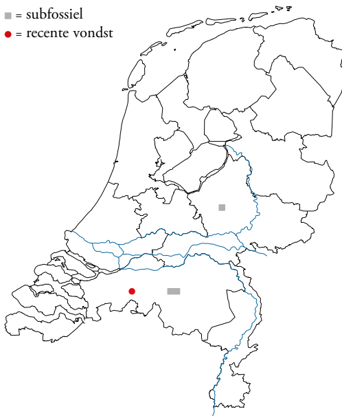
Figuur 6. De vindplaatsen van O. caledonicus in Nederland.