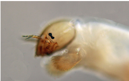
Figuur 3. Omisus caledonicus kop met de typische oogstreep.

larven er bijzonder uit (fig. 4). De kleur was lichtbruin, waar het mentum bij andere Chironomini vaak donkerbruin is. Verder werden de tanden van het mentum naar het midden toe kleiner, waardoor er een holle vorm ontstaat. Tussen de twee grotere centrale tanden leek nog één kleiner tandje te staan. Met een 100 x vergroting bleken dat twee kleine tandjes te zijn. Ook de antennen waren afwijkend (fig. 5). Ze bestonden uit zes segmenten, waar bij de meeste Chironomini vijf segmenten de norm is. Op segment II en III was een zogenaamd Lauterborn-orgaan aanwezig. Dat zijn in figuur 5 de doorzichtige ovale structuren van ongeveer tweederde van de lengte van de