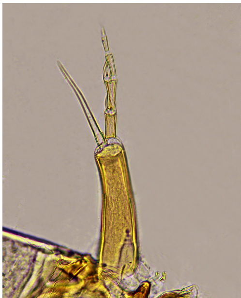
Figuur 5. Omisus caledonicus antenne.