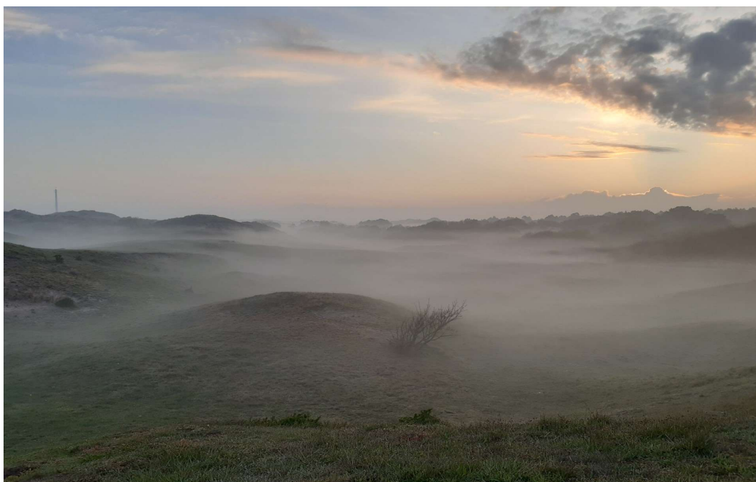
Noordwijkse golfclub in de mist