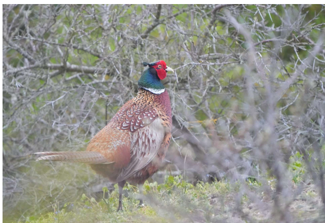
Fazant op de Noordwijkse Golfclub