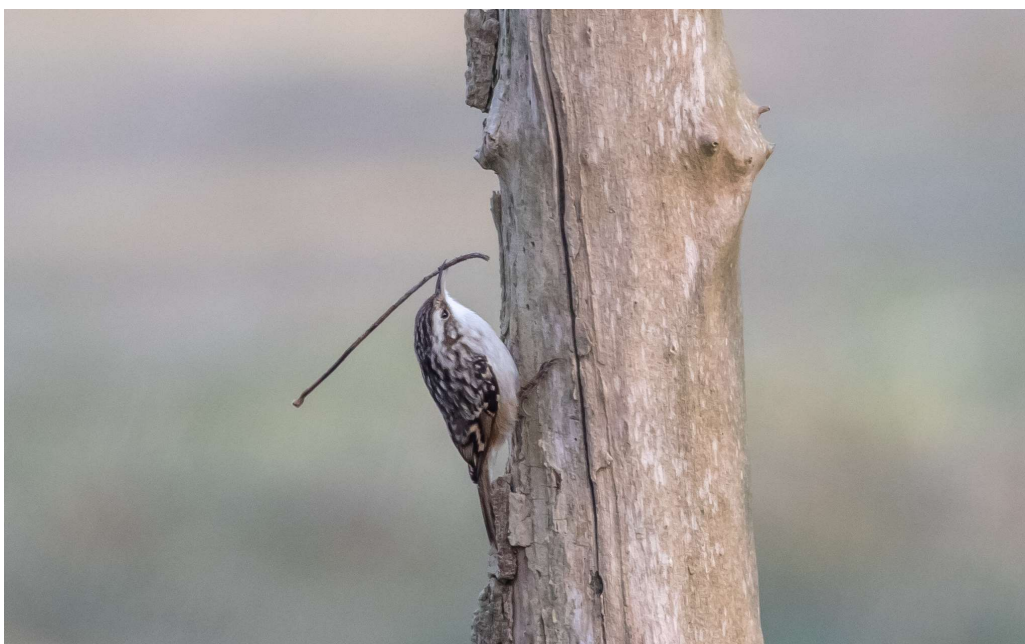
Boomkruiper met nestmateriaal