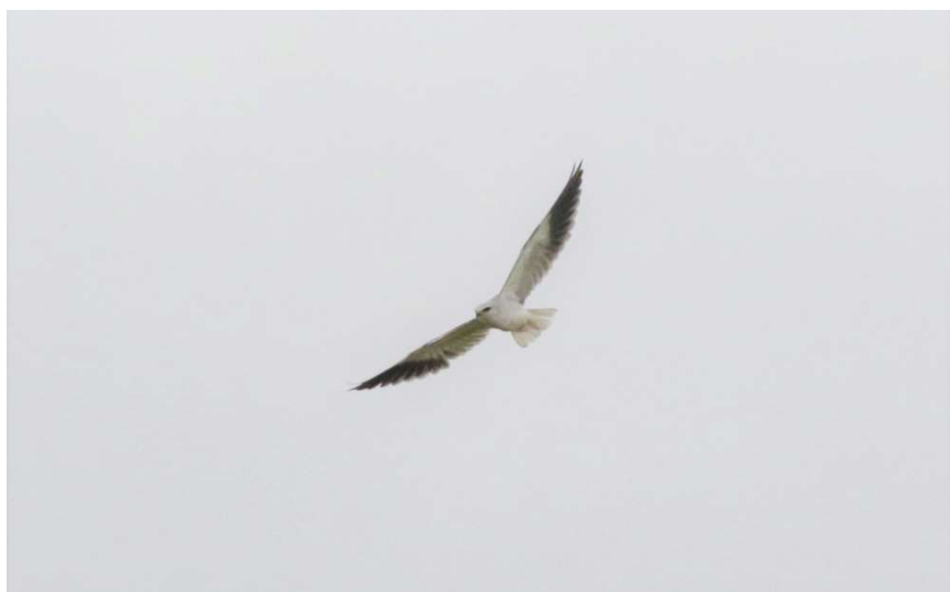
Grijze Wouw – 13 augustus 2023 Amsterdamse Waterleidingduinen - Vinkebaandriften / Franse Vlak

De Grijze Wouw is een langverwachte nieuwe soort voor Noordwijk. De waarnemingen in Nederland zitten in een sterk stijgende lijn. Tien jaar geleden stond hij nog bekend als dwaalgast, met maar een paar waarnemingen. Sinds 2014 wordt hij elk jaar gezien en dat is inmiddels in alle maanden van het jaar zo. De meeste waarnemingen zijn van maart tot mei en van augustus tot november. Tot nu toe was de kuststreek nog niet rijk bedeed met Grijze Wouwen. Ze lieten ons letterlijk links liggen, en vlogen tussen de 'hotspots' Zeeland, de Veluwe en het noordoosten van het land. De Grijze Wouw is een van de soorten die vanuit het zuiden in opmars is. Vanuit het zuidwesten van het Iberisch Schiereiland heeft hij zich in 1990 gevestigd in zuidwest-Frankrijk, waar de populatie sterk groeit. Sindsdien zijn er ook meer en meer waarnemingen elders in West-Europa. De Grijze Wouw is een opportunist die al zwerfend grote afstanden af kan leggen op zoek naar goede voedselgebieden. Het is een van de weinige roofvogels die meer dan één legsels per jaar kan groot brengen. Als de omstandigheden goed zijn, doen ze dat zelfs jaarrond. Daarin tonen ze zich als een van origine tropische soort, met de kern van de verspreiding in Afrika en zuid- en zuidoost-Azië. Maar een tropische soort die inmiddels ook een stevige voet aan de grond begint te krijgen in het westen van Europa. De eerste Grijze Wouw was langverwacht. Hoe lang zullen de volgenden op zich laten wachten?