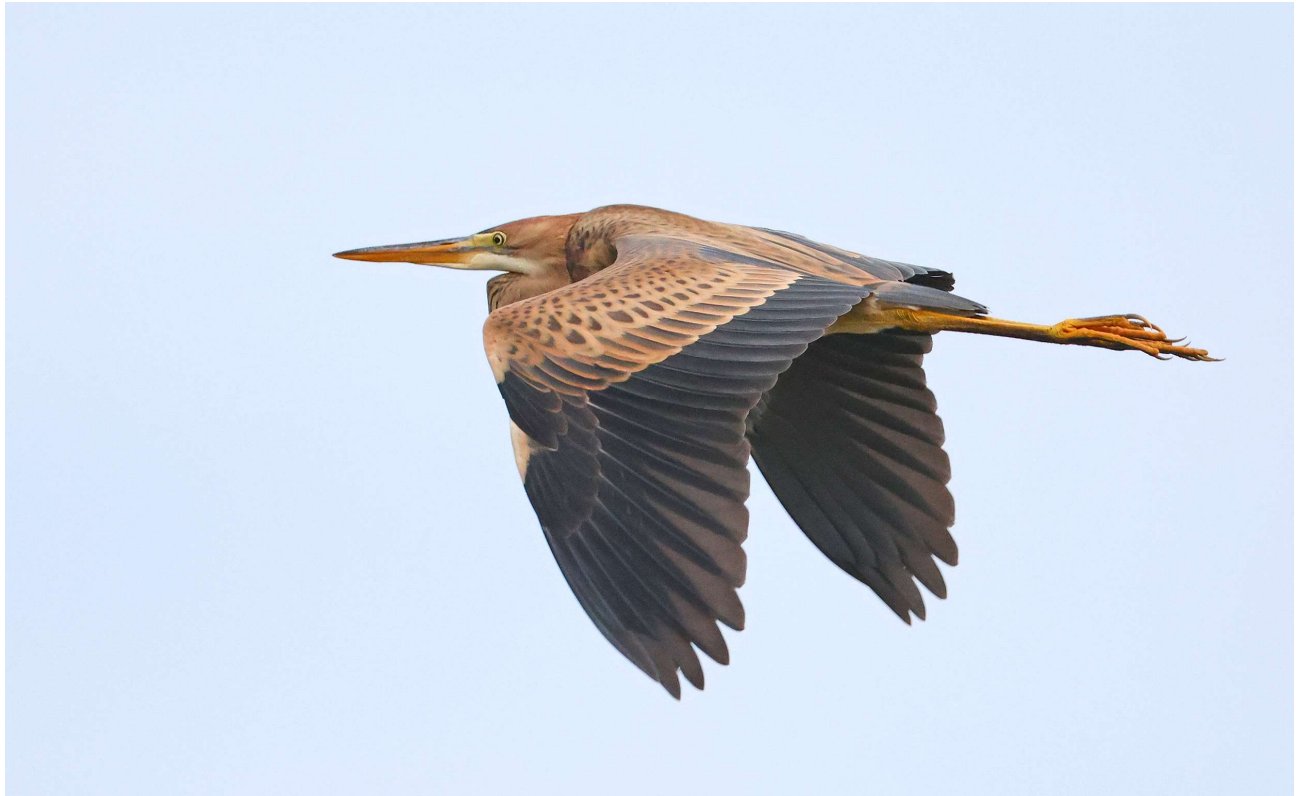
Purperreiger – 5 augustus 2024 - Katwijk aan Zee - De Puinhoop