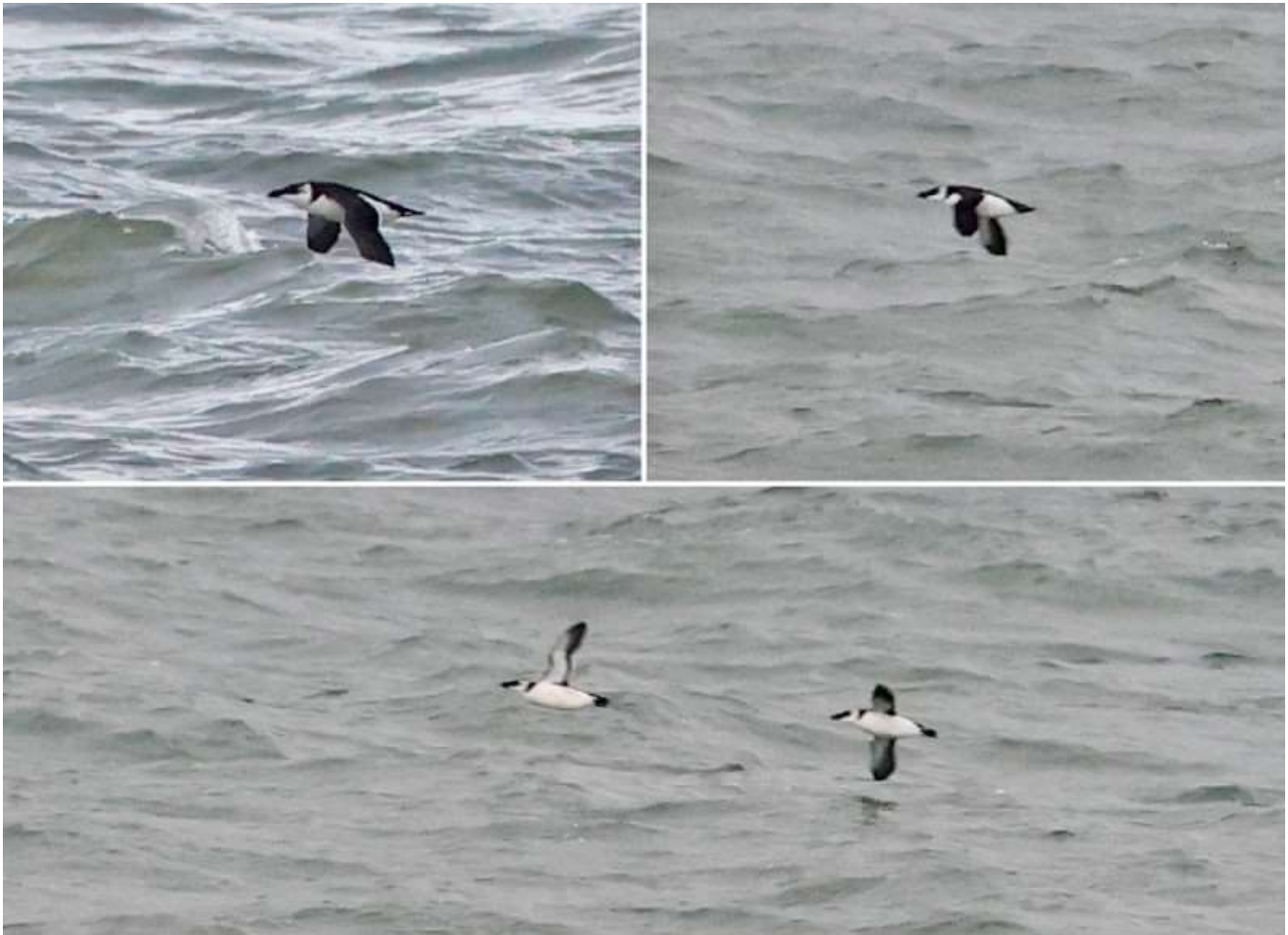
Alk - 29 september Strand – Katwijk aan Zee © René van Rossum