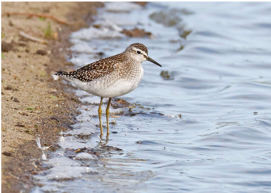
Bosruiter - 23 augustus 2023 Noordwijkerhout - Noordwijkerhoutsche Geest

Er stond dit jaar maar één perceel bollenland onder water. Dit lag in de Noordwijkerhoutsche Geest, aan het Westeinde van Noordwijkerhout. Het perceel was groot en goed te overzien vanaf de weg. Van 7 juli t/m 31 augustus stond er water op het perceel ter bestrijding van bodemziektes. Zoals gebruikelijk duurt het even voordat een perceel 'op gang' komt en vogels aantrekt. In juli werd het beeld vooral bepaald door broedvogels uit de omgeving: een grote groep Visdieven (maximaal 408 op 18 juli JD) en enkele Tureluurs en Grutto's. Oeverlopers vinden al snel interessante voedselplekken langs de randen van het perceel en waren vanaf het begin met enkele vogels aanwezig, met een maximum van 13 op 15 augustus (RR). Eind juli en begin augustus waren Zwarte Stern en Grote Stern onverwachte gasten. Deze verschijnen niet vaak op onder water gezet bollenland. Van 31 juli t/m 14 augustus waren 1-2 Zwarte Sterns aanwezig. Op 2 augustus zaten er 2 Grote Sterns (RR) en op 4 augustus zelfs 12 (GC). Rond 10 augustus begon het een vaste plek te worden voor doortrekkende steltlopers.