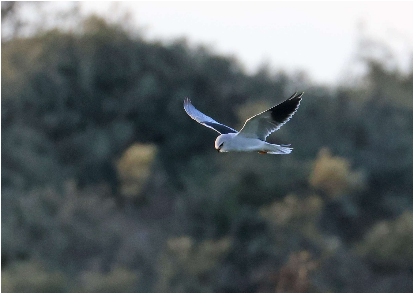
Grijze Wouw – 12 augustus 2023 - Amsterdamse Waterleidingduinen - Starrenbroek

Op 11 augustus spoelde op het strand van de Coepelduynen een Fint aan, een trekvis die vrijwel uit Nederland is verdwenen. In Rijnsoever Katwijk bivakkeerde in de woonwijk een Bunzing (AM).