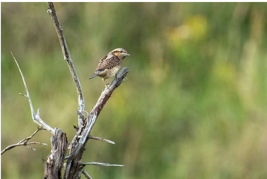
Draaihals – 23 augustus 2023 - Amsterdamse Waterleidingduinen - Marelvak

De septembermaand was de één na warmste van deze eeuw. Het koele weer van augustus sloeg met een oostelijke stroming snel om. De week van 5 tot 10 september was de warmste week van het jaar, wat uitzonderlijk is. Vanaf 11 september ging de warmte geleidelijk over in 'normaler' herfstweer met een westelijke stroming en overtrekkende storingen. De zuidwestenwind voerde nog steeds warmte aan, waarmee de temperaturen relatief hoog bleven en nog af en toe zomers waren.