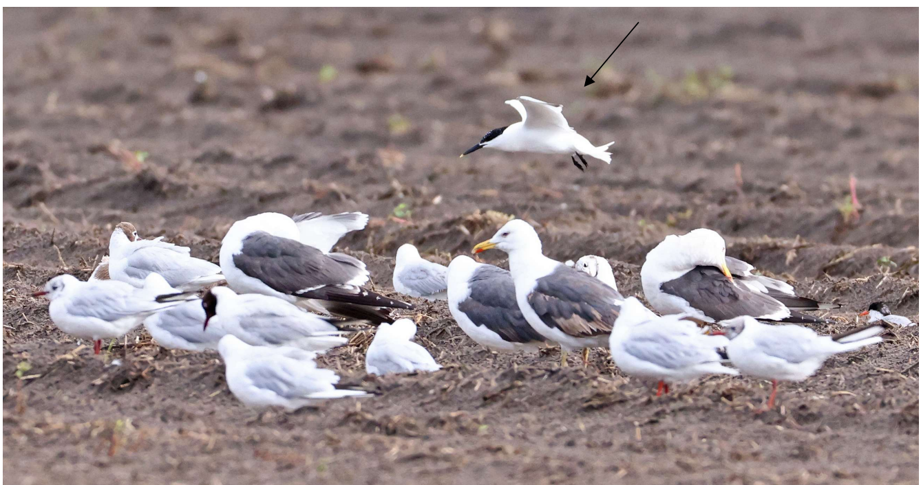
Grote Stern - 1 augustus 2023 Noordwijkerhout - Noordwijkerhoutsche Geest

De Grote Jagers zijn de andere hoofdrolspeler in de virusuitbraak in 2022. In de loop van jaren waren we door de groei van de populatie steeds meer Grote Jagers gaan zien. Zo vlogen er op 22 september op één dag 10 langs. In 2021 kwam het totaal voor de hele herfst op één vogel (in september). Dit jaar passeerden er twee in september. De Grote Jagers hebben waarschijnlijk een nog langere weg naar herstel te gaan dan de Jan Van Genten en de Grote Sterns.