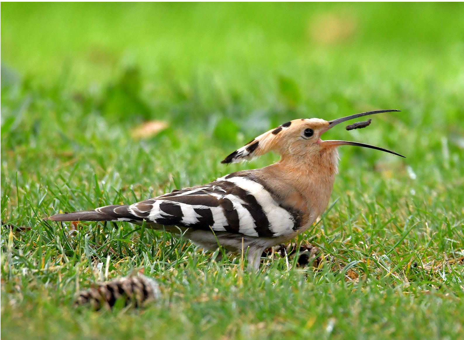
Hop – 17 september 2023 - Noordwijkerhout