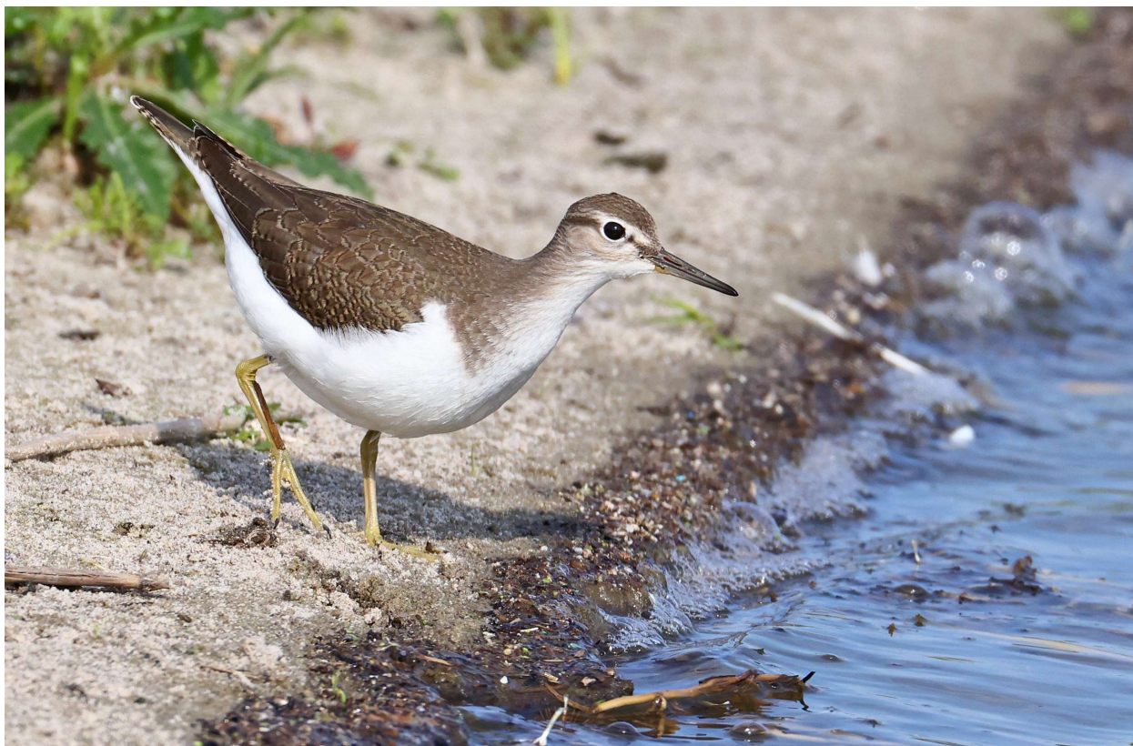
Oeverloper – 23 augustus 2023 Noordwijkerhout - Noordwijkerhoutsche Geest

(maximaal 3 op 18 augustus EH), Kempphaan (maximaal 7 op 18 augustus EH), Zwarte Ruiter (maximaal 3 op 15 augustus GH MW), Groenpootruiter (maximaal 5 op 18 augustus WBo) en Witgat (6 op 11 augustus RM AM) regelmatig op het perceel aanwezig