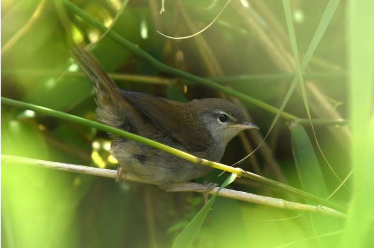
Cetti's Zanger - 4 augustus 2023 Noordwijkerhout - Oosterduinse Meer

Er was dit kwartaal nog een aantal aanvullingen op het overzicht in de vorige Strandloper van broedgevallen van schaarse soorten in ons waarnemingsgebied. Met nog een aantal waarnemingen in juli kwam het aantal territoria van Nachtzwaluw op minimaal drie, in de Noordduinen en in de De Blink (JF ea). In het Langeveld verbleven op 2 juli nog steeds 2 Fluiters , een teken dat de eerdere in het voorjaar zingende vogel geen passant was maar waarschijnlijk een broedvogel (AMo SH). Het broedgeval van de Cetti's Zanger bij het Oosterduinse Meer werd bevestigd door de waarneming van 2 juvenielen op 4 augustus (CZ). Op 26 juli riepen er 2 Kwartels in het grasland bij Sancta Maria (PK). In Kloosterschuur, Rijnsburg was op 21 juli een roepende jonge Ransuil aanwezig (MG).