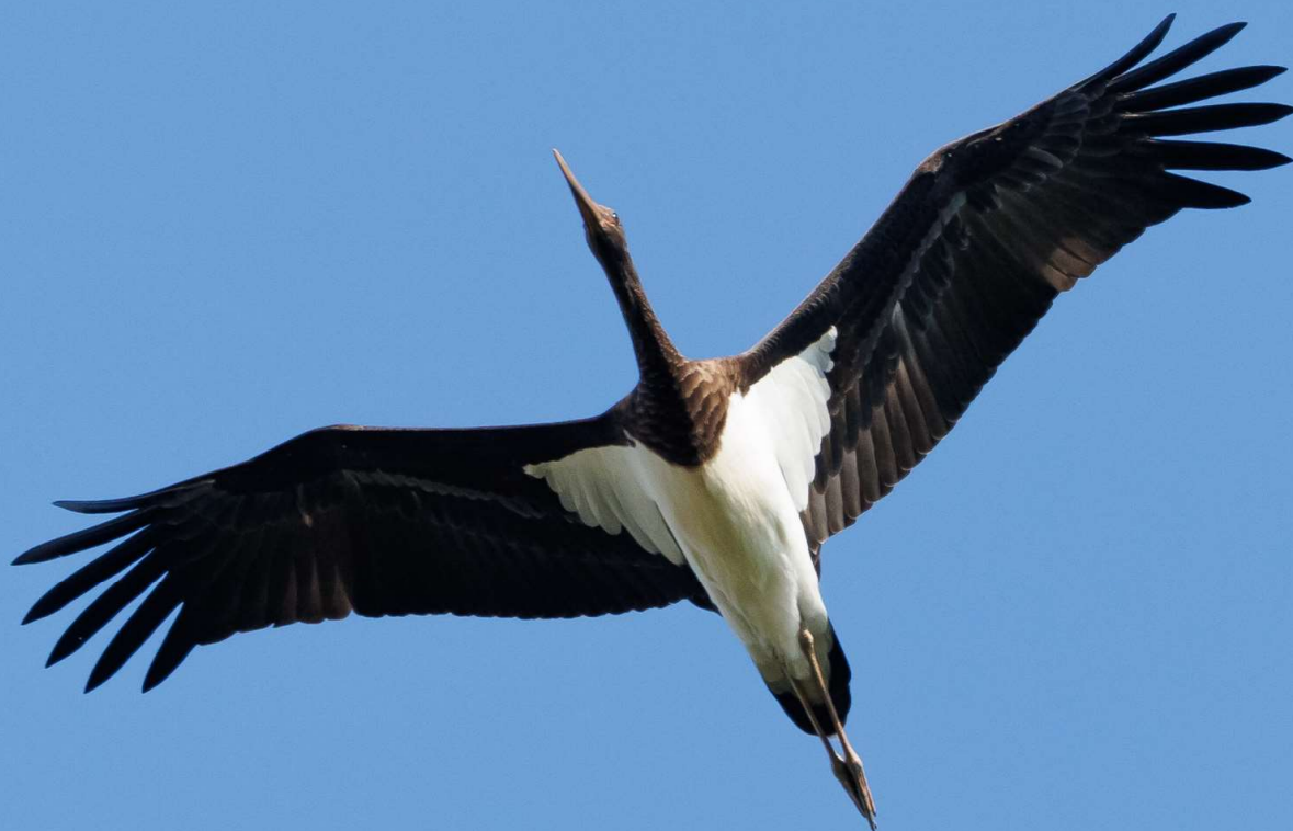
Zwarte Ooievaar – 10 augustus 2023 - Noordwijkerhout - Noordwijkerhoutsche Geest © George Hageman

bron: www.waarneming.nl . NB overzicht exclusief waarnemers met onvolledige naam.