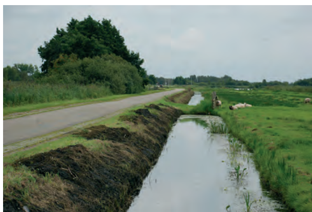
Fig. 9. Gefaseerd schonen in de Rottige Meenthe. Links zijn waterplanten verwijderd en rechts is de onderwatervegetatie gespaard. Het volgend jaar doet men het anders om. Een dergelijk beheer is gunstig voor de Platte schijfhoren, maar ook voor de andere zoetwaterorganismen.

Tot slot is het van belang dat er geen leefgebied van deze soort verloren gaat door het dempen van sloten (bij schaalvergroting in de landbouw of bij de bouw van woningen en bedrijventerreinen) en dat de onderwatervegetatie niet beschadigd wordt door gemotoriseerde scheepvaart en recreatievaart.