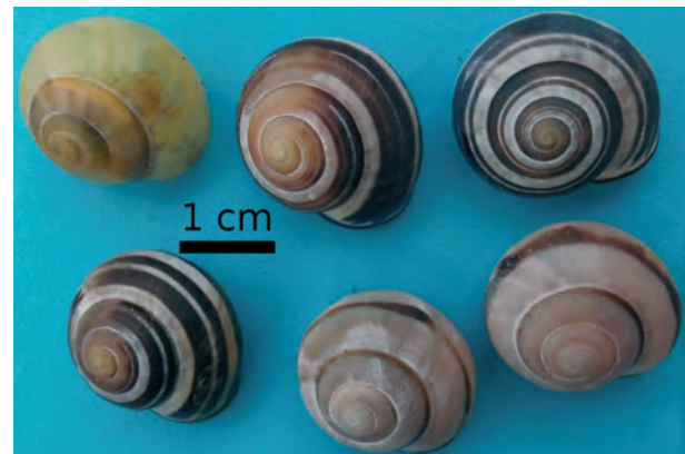
Fig. 5. Huisjes van Gewone tuinslakken Cepaea nemoralis verzameld tussen mariene schelpen aan de zuidzijde van Langevelderslag, 17-12-2013. Het exemplaar linksboven bevat een nog vrijwel complete, maar dode, slak.