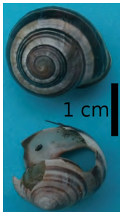
Fig. 4. Huisjes van Gewone tuinslakken Cepaea nemoralis uit het niet-afgeslagen deel van de zeereep ten noorden van Langevelderslag, 17-12-2013.