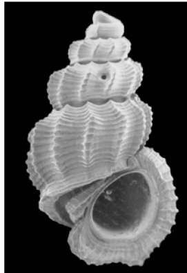
Fig. 4. Manzonina pelorum Moolenbeek & Faber, 1987.

ondergebracht. Ook zijn eigen collectie werd volledig gedigitaliseerd en van ZMA-labels voorzien. Hij stond altijd klaar om vrienden te helpen met hun computerproblemen, al dan niet op malacologisch gebied.