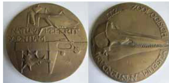
Fig. 6. Erepenning ZMA ' Natura Peperit Scientiam '.