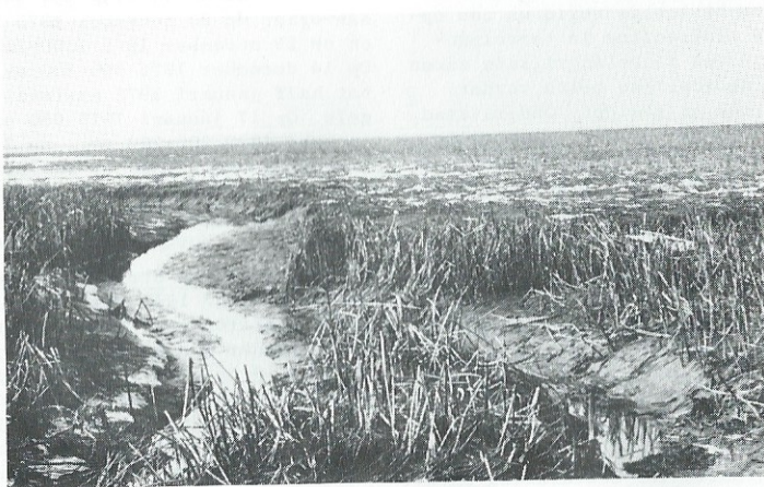
Spuimond - ganzenslaapplaats op de Korendijkse slikken

8) Overflakkee Op 7 februari 1976 550 ex. Den Bommel op graszaad en 175 ex. Achthuizen, eveneens op graszaad. Slaapplaats: Ventjagersplaat.