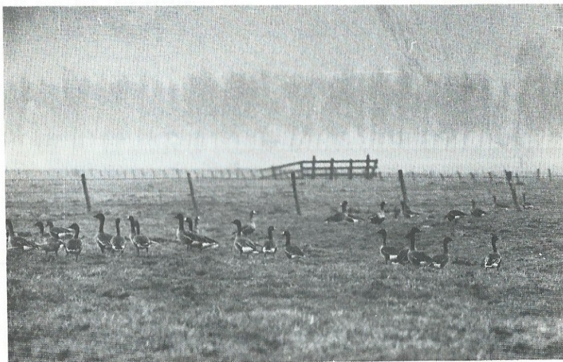
Rietganzen en kolganzen - Oude Land van Strijen - februari 1972

Er zijn teveel hiaten om een afgerond totaal-aantalverloop voor de noordelijke delta over 1975-76 te geven. Bovendien spelen de reeds vermelde verplaatsingen binnen de regio een rol. Deze verplaatsingen kunnen de laatste jaren overigens wat gemakkelijker worden gevolgd door de rietganzen, die in de DDR door Dr. Litzbarski gemerkt worden, aangenomen dat de gemerkte exemplaren steeds bij dezelfde gezelschappen blijven.