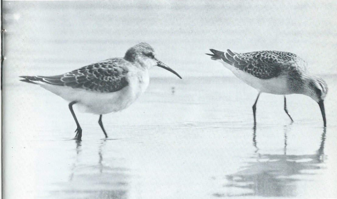
Tabel 2: Aantallen krombekstrandlopers en bonte strandlopers: enige vergelijkende waarnemingen; ZH=Zwarte Haan; WH=Westhoek.