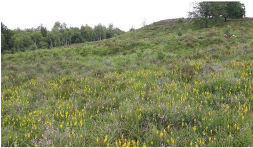
FIGUUR 2 Overzichtsfoto van het meest westelijk gelegen hellingveen van de Brandenberg; de gele bloemen zijn van Beenbreek ( Narthecium ossifragum ).

lingshoek. Het gaat om drie slenken met ongeveer 25 m hoogteverschil vanaf bovenop het plateau tot onderaan de helling [figuur 3 & 4]. Vermoedelijk is de veenontwikkeling aan de voet van de hellingen begonnen als gevolg van het uittrekken van basenarm lokaal grondwater, anders gezegd: weer opkomend regenwater dat iets hoger op het plateau is geïnfilteerd. Onder dergelijke natte (zuurstofarme) en relatief zure (weinig gebufferde) omstandigheden worden plantenresten niet of slecht afgebroken, zodat er veenvorming kan plaatsvinden.