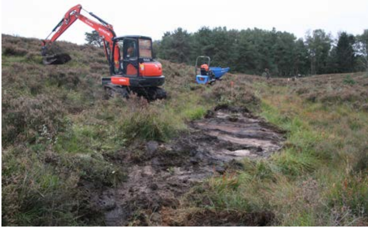
FIGUUR 6 Een foto van de plagwerkzaamheden bij het meest zuidelijk gelegen hellingveen op de Brandenburg, oktober 2020.