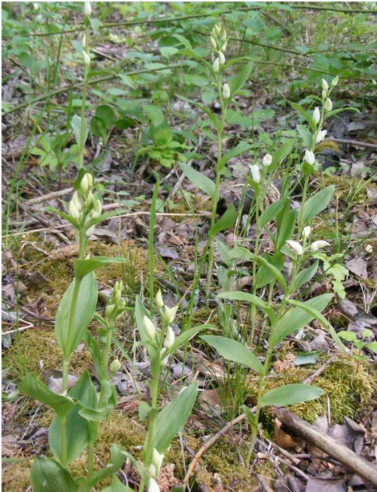
FIGUUR 5 Talrijk voorkomen van Bleek bosvogeltje ( Cephalanthera damasonium ) in een jong hakhoutbosje. De bloemknoppen blijven ook in bloei veelal gesloten, omdat deze soort autogaam is. Gemeente Gulpen-Wittem, 14 mei 2020.

19 kilometerhokken is aangetroffen. CLAESSENS & KLEYNEN (2020) vonden in de loop van 2019 in totaal enige honderden planten, beduidend meer dan de zeer geringe aantallen die tussen 1990 en 2010 in Zuid-Limburg nog gevonden konden worden; er waren toen nog slechts enige tientallen exemplaren aanwezig. Zij troffen Bleek bosvogeltje in 2019 aan op 19 locaties in tien kilometerhokken waarin ze de afgelopen decennia ook was aangetroffen. Door de eerste auteur werd Bleek bosvogeltje in het voorjaar van 2020 echter in vijf nieuwe kilometerhokken gevonden, alsmede in één kilometerhok waarin ze voor 1980 volgens KREUTZ (1994) ook aangetroffen werd [figuur 4]. Hierbij gaat het om drie belangrijke populaties en drie locaties met één of enkele exemplaren. De eerste auteur vond in totaal 600 bloeiende planten, waarvan de meest omvangrijke populatie uit maar liefst 500 generatieve Bleke bosvogeltjes bestaat (VERHART & KREUTZ, 2020) [figuur 5]. Een dergelijk groot aantal exemplaren was in Zuid-Limburg, en daarmee in Nederland, reeds tientallen jaren niet meer op één groeiplaats gevonden. Daarmee gaat het om een verdubbeling van het in totaal in Nederland bekend aantal planten en is er thans sprake van de grootste populatie in de Benelux (KREUTZ, 2019, GHYSELINK, persoonlijke mededeling, VAN DEN BUSSCHE, persoonlijke mededeling).