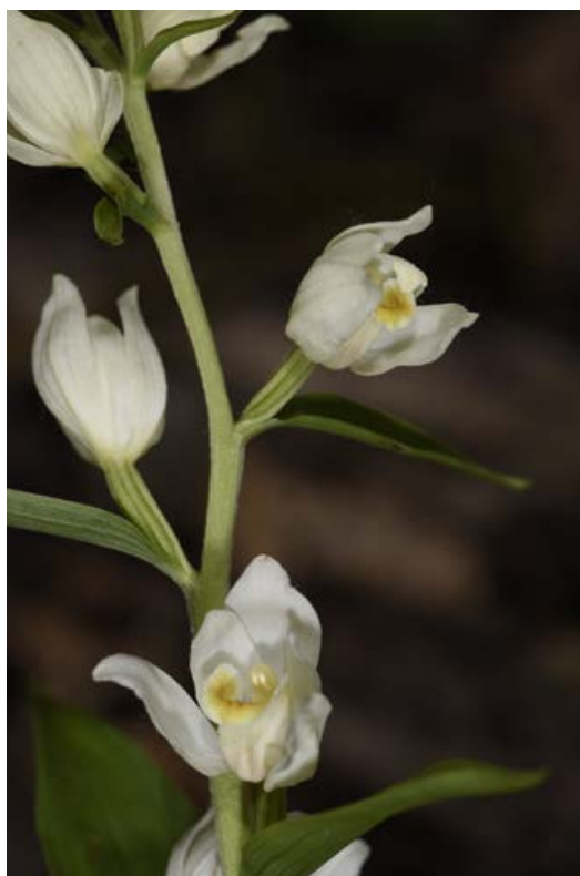
FIGUUR 6 Bleek bosvogeltje ( Cephalanthera damasonium ). Gemeente Gulpen-Wittem, 18 mei 2020.

Brede wespenorchis is thans in Zuid-Limburg naast Grote muggenorchis ( Gymnadenia conopsea ) de meest talrijke orchidee. Brede