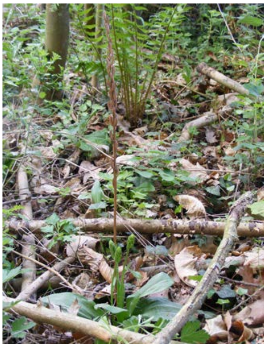
FIGUUR 3 Vegetatief vermeerderde Bergnachtsorchis ( Platanthera chlorantha ) in knopstadium, met bloeiwijze van het vorige seizoen. Gemeente Eijsden-Margraten, 27 april 2020.

al spoedig. In situaties waarin planten en andere organismen steeds bestreden werden, zoals op voormalige landbouwgronden, ontstaan kansen voor orchideeën door het betrekken van energie uit de zich spoedig rond de wortelstelsels van de aangeplante bomen ontwikkelende mycorrhiza. Veel ectomycorrhiza kunnen kennelijk slecht tegen stikstof, maar enkele kunnen er wel goed tegen (OZINGA, 2015). De meeste orchideeën komen dan ook vlakbij de bomen op.