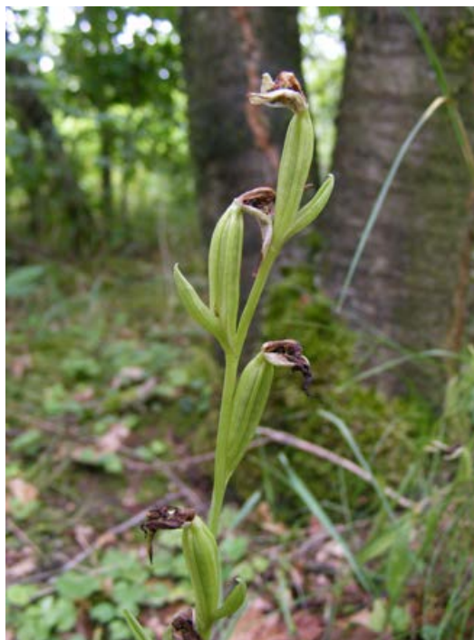
▼ FIGUUR 10 Bijenorchis ( Ophrys apifera ) in vrucht- zetting. Gemeente Heerlen, 2 juli 2020.

een echte pionier als Brede wespenorchis meestal spaarzaam voorkomt en dan voornamelijk nog secundair langs bospaden. In bosjes waarin veel rijen gelijke boomsoorten zijn aangeplant, treedt Brede wespenorchis vaak talrijk op, maar is Grote keverorchis vrijwel geheel afwezig. Ze komt eerder voor in meer gevarieerde en meer spontaan ontwikkelde bosjes, maar ook daar is ze overwegend in geringe aantallen aangetroffen. In zeven jonge loofbosjes waarin de eerste auteur Grote keverorchis vond werden slechts 88 generatieve exemplaren geteld, waarbij maar op één plaats (in de gemeente Eijsden-Margraten) meer dan tien exemplaren