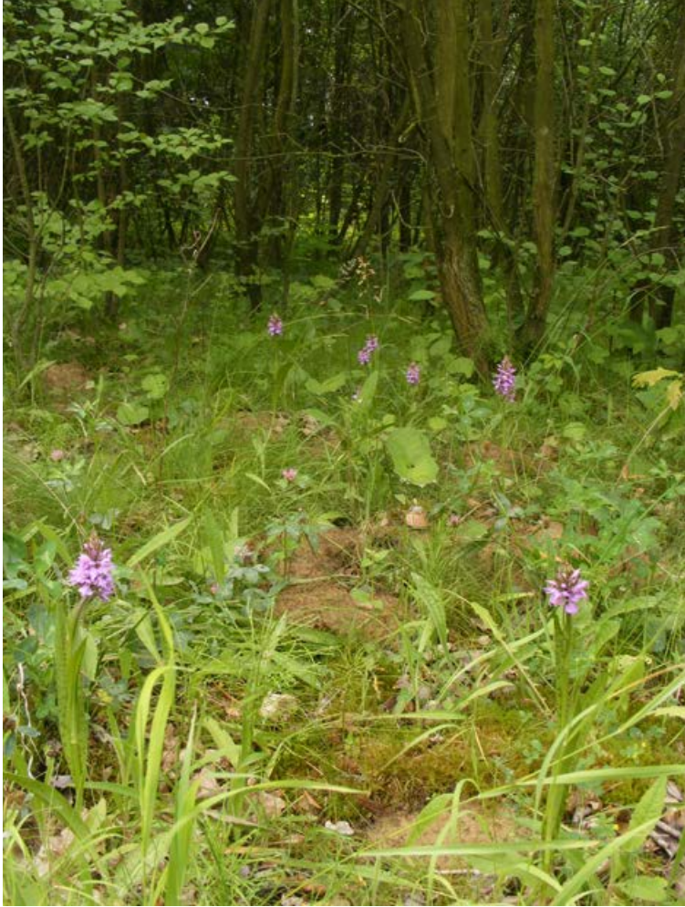
FIGUUR 11 Gevlekte rietorchis ( Dactylorhiza praetermissa var. junialis ). Gemeente Meerssen, 22 juni 2020.

aangetroffen werden. Meestal kwam waar Grote keverorchis aanwezig was ook Brede wespenorchis voor en soms Bergnachtorchis, Bijenorchis, Grote muggenorchis en/of Soldaatje.