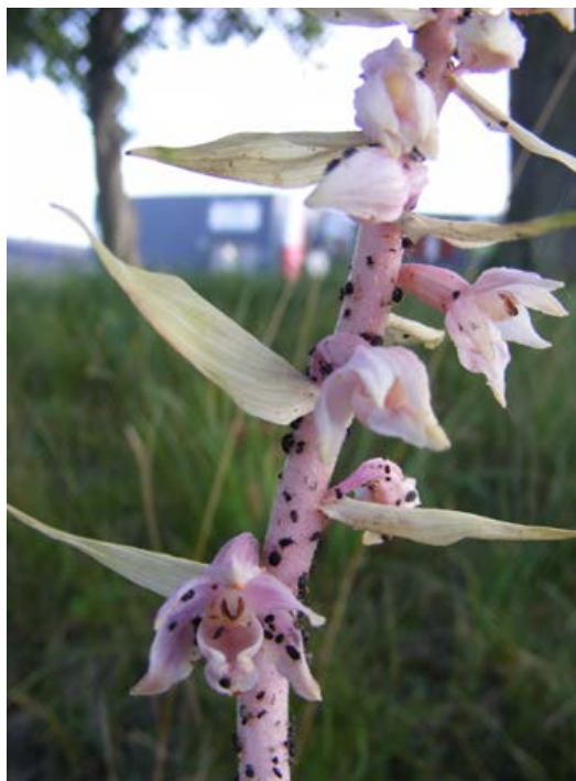
◀ FIGUUR 9 Chlorotische “roze” Brede wespenorchis ( Epipactis helleborine var. monotropoides ). Door het ontbreken van bladgroen kleurt de plant geheel lichtroze. Gemeente Maastricht, 20 juli 2020 (foto: F. Verhart).

Grote keverorchis kan, gezien de waarnemingen, niet aangemerkt worden als een kolonisor van jonge loofbosjes in Zuid-Limburg. Dat is best opmerkelijk gelet op haar veelvuldige voorkomen in volwassen bosopstanden. De lichtcondities maken jonge loofbosjes voor Grote keverorchis niet ongeschikt. Snelle kolonisatie is voor deze soort niet nodig. Ze heeft een zeer lange levensduur en handhaaft zich juist goed in oudere bostypen, waar