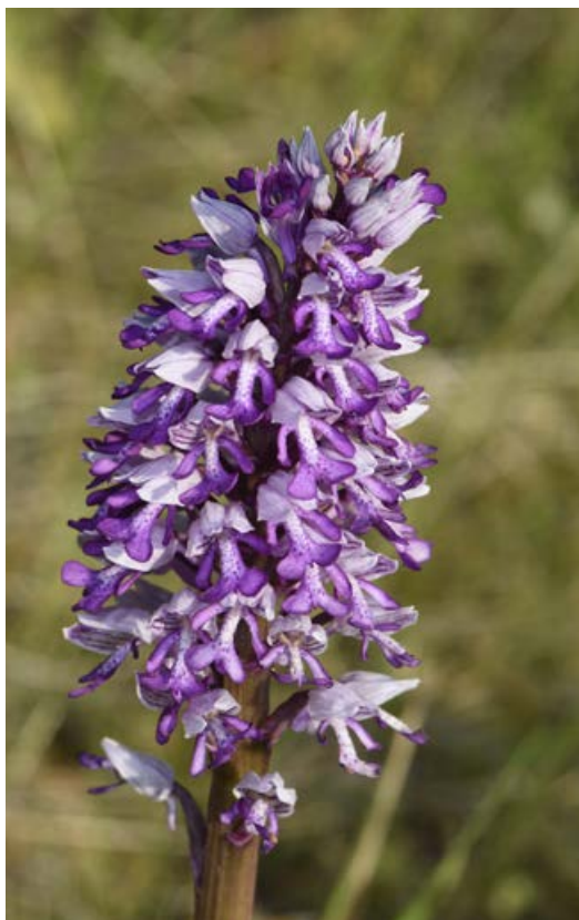
▲ FIGUUR 12 Soldaatje ( Orchis militaris ). Gemeente Voerendaal, 18 mei 2020.