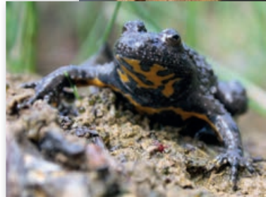
GEELBUIKVUURPAD (BOMBIINA VARIEGATA)