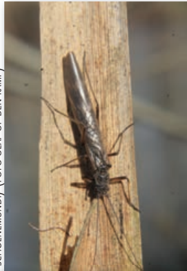
NEGENDOORNIGE WINTERSTEENVLEGG (TRAEINOPTERYX SCHOENEMUNDI)