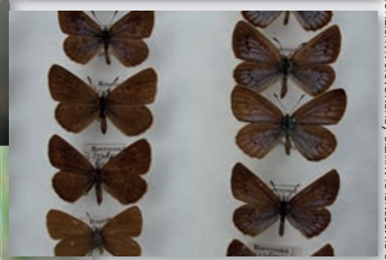
PHENGARIS NAUITHOUS)