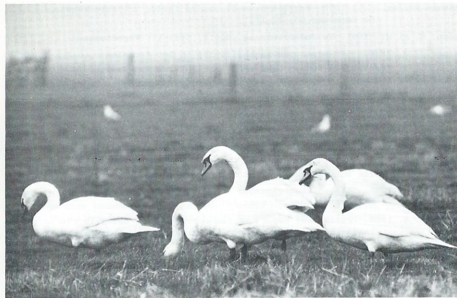
Knobbelzwanen fouragerend op grasland in de Arnhemse polder-febr. 1973

De overige cijfers werden verkregen door tellingen welke onder auspiciën van het R.I.N. plaatsvonden.