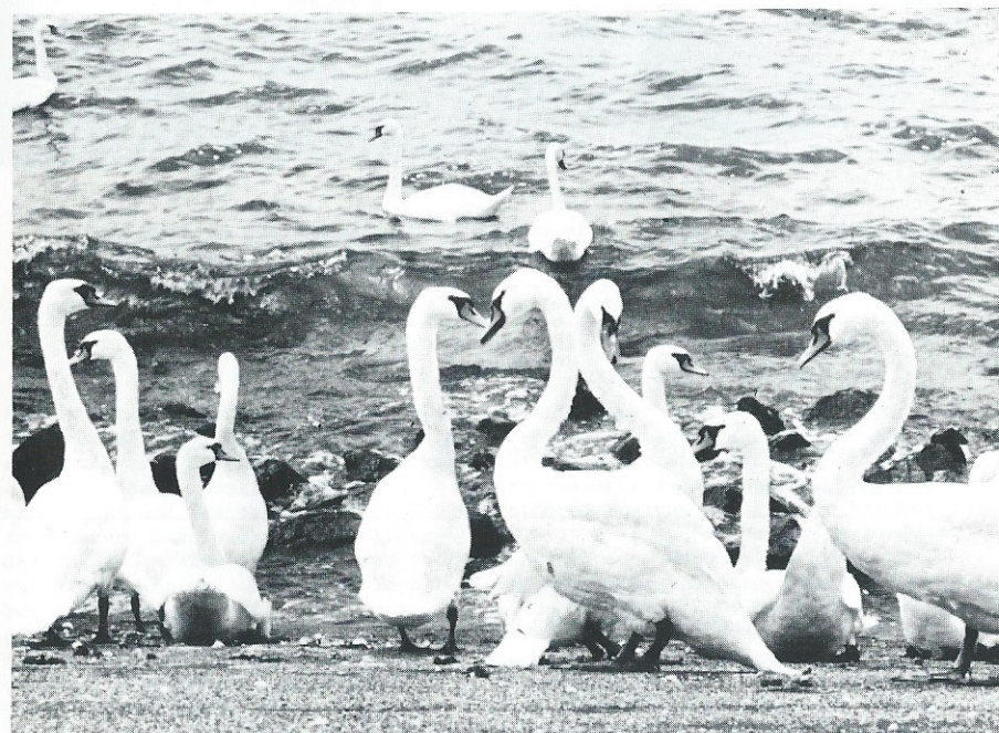
Ruïende knobbelzwanen rustend op Markerwaarddijk - aug. 1975

Doordat na de oorlog veel van de jongen van de "tamme" zwanen niet meer zoals voorheen werden opgevangen, kwamen steeds meer vogels in het wild tot broeden. De huidige vrij vliegende populatie is dan ook hoofdzakelijk opgebouwd uit nakomelingen van deze tamme knobbelzwanen, aangevuld met enkele wilde soortgenoten, die na strenge winters hier achterbleven (Timmerman, 1957).