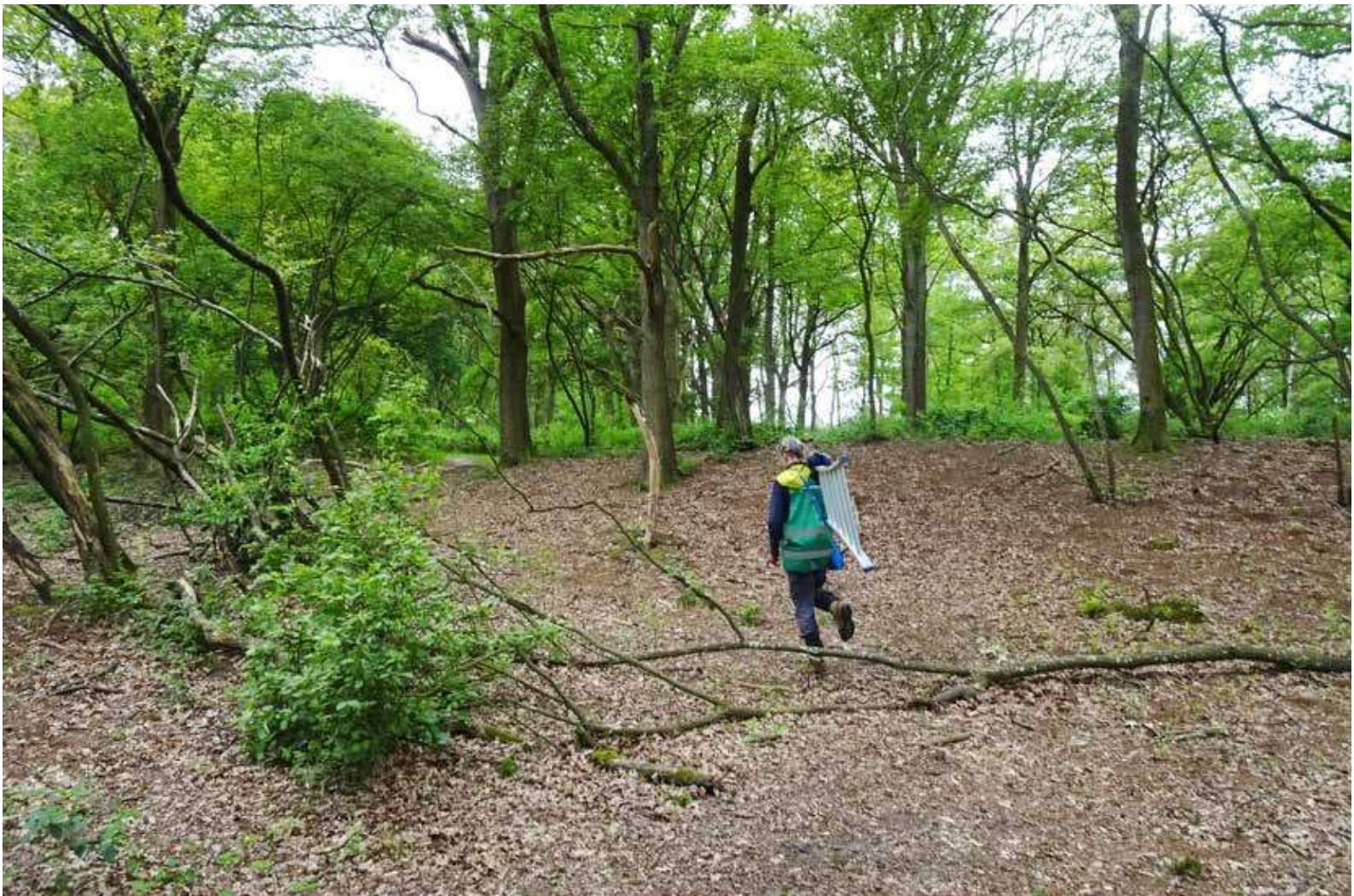
Heidebloem, 2-6-2023 | Hanneke Cusell

open te maken. Anders schrikken ze en vliegen ze eruit terwijl ze dat nog niet goed kunnen en dan kunnen ze 's nachts onderkoeld raken. Kool- en Pimpelmezen vliegen na 17 – 19 dagen uit en blijven dan nog een paar dagen in de buurt van de nestkast.