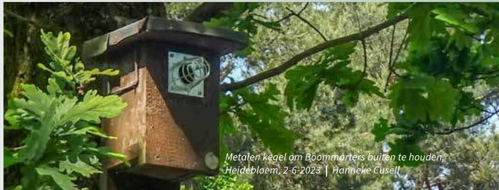
Metalen kegel om Boommarter buiten te houden, Heidebloem, 2-6-2023

Na tweemaal een korte pauze zijn vier uur later alle nestkasten gecontroleerd. Ook worden vanmiddag zo'n vijftien nestkasten schoongemaakt omdat de jongen uitgevlogen zijn of omdat de eitjes er al zo'n vier weken in lagen zonder dat er een ouder te zien was. Door het schoonmaken is dit de drukste periode. Een week later mag ik met Coby Jeninga mee om de nestkasten in Heidebloem te controleren; ook een gebied van GNR met 65 nestkasten. Het is een terrein met veel bramenstruiken en brandnetels, dus de oude broek en stevige schoenen die Coby had aangeraden zijn geen overbodige luxe. In een door een raster omgeven gebied, waar voorheen schapen graasden, zien we behalve nestkasten ook een eekhoortje en twee plekken waar duidelijk reeën hebben gelegen. Ook horen en zien we twee kleine