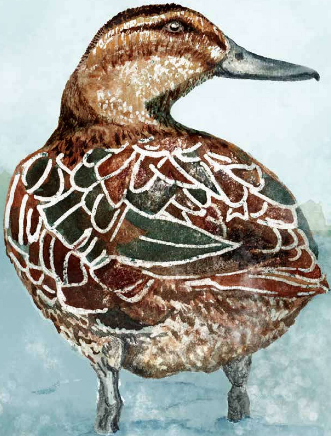
Vrouwtje Zomertaling, illustratie in aquarel | Gerda Baas