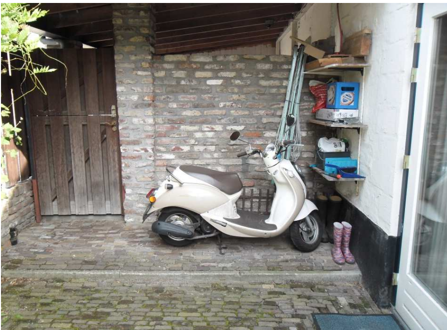
Figuur 1. Een geschikt biotoop voor de kleine muurspinnendoder, deze situatie moet op meer plekken te vinden zijn in Nederland.

(desoriëntatie?). Vrouwtje 1 wijkt volledig af van haar route naar het nest en vrouwtje 2 verlies ik al snel uit het oog. Geen van beiden bevinden zich in de goede richting. Terwijl ik aan de keukentafel zit om enkele notities te maken zie ik plots vrouwtje 2 met haar spin op circa 1.5 m. hoogte binnen over de muur lopen. Niet geheel conform de regels der natuur help ik haar op de goede weg en via een omweg (keukendeur, buitenmuur en scooter) weet ze het spoor naar haar nest weer te vinden. Niet veel later verschijnt ook vrouwtje 1 weer met haar spin ten tonele en zij is op de goede weg.