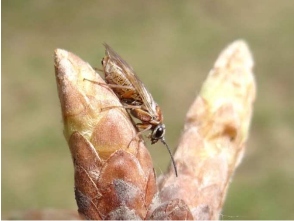
Fig. 3. Periclista pilosa vrouw op een eikenknop; een van de nieuwe bladwespen voor ons land waarover Pierre en ik (AM) regelmatig hebben gesproken (Moerputten 1 mei 2005).

Ik heb lange tijd weinig contact meer met Pierre gehad, vooral in de periode dat het slecht met hem ging. Maar het deed me veel plezier hem in de afgelopen twee jaar weer te zien op de vergaderingen van de afdeling Zuid van de NEV. Hij sprak daar weliswaar niet meer over bladwespen, maar hield enthousiaste verhalen over de parasitaire wespen waarmee hij zich op dat moment bezig hield.