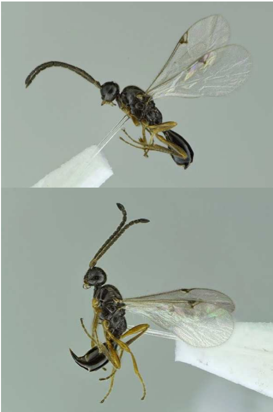
Fig. 4. Exallonyx wasmanni (boven, man 8.xii.2015; onder vrouw 28.x.2015), Simpelveld, Schilterstraat 60, alt. 150 m, eigen tuin, YPTrap, leg. en det. Pierre Thomas 2015. Deze priemwespen zijn vastgeplakt aan hoofdhaar van de verzamelaar.

Nu weet ik waarom. Ik mis hem. Wat vreselijk jammer dat hij nu al moest heengaan. Familie en alle anderen, die hem van nabij kenden, wensen wij veel sterkte met dit verlies.