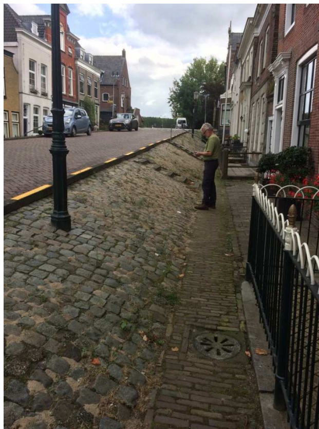
Fig. 1. Locatie van de nestaggregatie.

Wij hebben daarna geprobeerd in de omgeving zeeaster ( Aster tripolium ) te vinden. Wat ons echter niet gelukt is. Wij kwamen tot de slotsom dat de zijdebijen ver moesten vliegen om stuifmeel te kunnen halen.