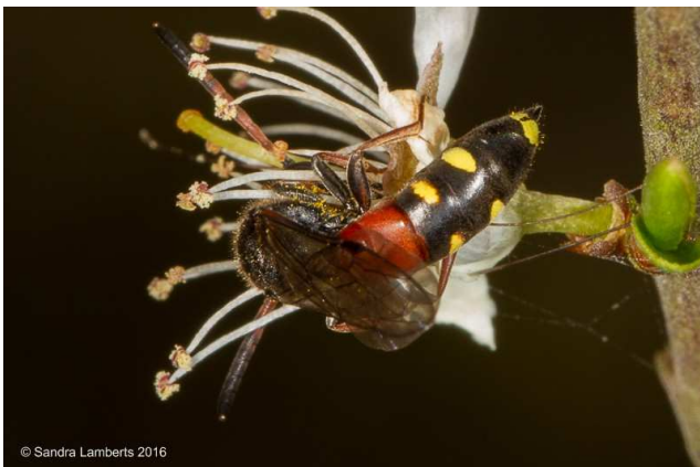
Vrouwtje van Sapyga similis .

Een vrouwtje op 21 april in het Noord-Hollands duinreservaat, gebied Egmond (Ac. 103.7-511.2).