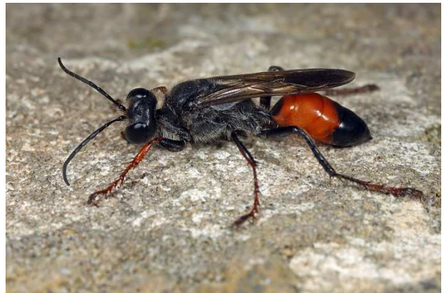
Figuur 2. Sphex funerarius vrouw.

Op 6 juli twee mannen op het Zinkwitterrein in Maastricht (Ac. 177-319). Op 6 juli op De Kaloot (Ac. 38,7-383,5) meer dan 10 exemplaren gezien, één man verzameld (Fig. 2). Op 8 augustus 30 exemplaren in Domburg, Westhove (Ac. 25,656-399,468). Op 11 augustus een vrouw bij Stellendam, Scheelhoek (Ac. 64,0-425,5).