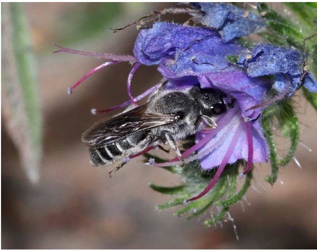
Figuur 3. Hoplitis adunca vrouw op slangenkruid. Foto Pieter van Breugel.

Vanaf 16 mei een vrouw meer dan een week waargenomen op slangenkruid in de tuin in Veghel (Ac. 166,2-404,1) (Fig 3).