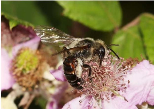
Figuur 4. Andrena trimmerana vrouw op braam.

Een vrouw op 5 juli op braam Rammekensweg, Ritthem (Ac. 33,9-386,5) (Fig. 4).