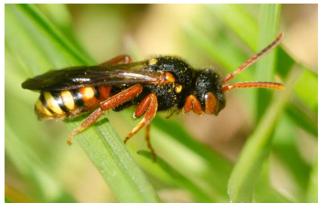
Figuur 2. Vrouwtje van bonte wespbij Nomada bifasciata , broedparasiet van de weidebij Andrena gravida .

De soort met de hoogste presentie is de grasbij Andrena flavipes , die op elke dijk voor kwam (Fig. 4). Gevolgd door de steenhommel Bombus lapidarius en de dikkopbloedbij Sphecodes monilicornis . Daarna volgt de zeldzame weidebij Andrena gravida , die op acht van de elf onderzochte dijken werd aangetroffen.