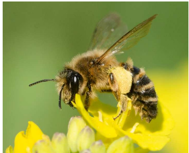
Figuur 3. Vrouwtje van grasbij Andrena flavipes op raapzaad. Foto Linde Slikboer.

2) Grauwe Kiekendief – Kenniscentrum Akkervogels.