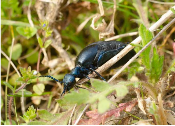
Figuur 3. Vrouwtje van gewone oliekever Meloe proscarabaeus . Foto Linde Slikboer.

van de talrijkheid ervan. Dit is een nieuwe vindplaats van een soort die nagenoeg lijkt te zijn verdwenen in het zuidwesten van Nederland. Toevalligerwijs werden diezelfde maand ook op twee andere plekken oliekevers gefotografeerd ( waarneming.nl ). In beide gevallen ging het om waarnemingen op dijken rondom het Haringvliet.