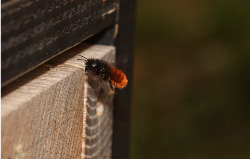
Figuur 4. Een vrouwtje gehoornde metselbij Osmia cornuta , een soort met een sterke binding met bebouwde omgeving. Typisch is het bovengronds nestelen in bestaande holtes in onder andere de voegen van oude muren en bijenhôtels. Daarnaast is het een polylectische soort aan de noordrand van haar areaal zonder koekoeksbij.

In tegenstelling tot wat we verwacht hadden, zijn bijensoorten geassocieerd met bebouwing niet veel vaker zuidelijke soorten dan gemiddeld (Tabel 2). Mogelijk zou er wel een verband zijn, mochten we de analyse specifiek gedaan hebben met enkel die gebieden met het warmste microklimaat, zoals stenige spoorwegterreinen (hier niet meegeteld) en de stadscentra (ruderaal terreintjes en groendaken). Wel zijn bijen met een zuidelijke verspreiding minder vaak negatief geassocieerd met bebouwing. Ze zijn immers ondervertegenwoordigd in de categorie soorten met een negatieve associatie en oververtegenwoordigd bij de neutrale soorten. Een mogelijke verklaring is dat de hogere temperaturen in bebouwd gebied voor meer zuidelijke soorten in zekere mate kunnen compenseren voor mogelijke negatieve effecten van bebouwing op nestgelegenheid of bloemenaanbod.