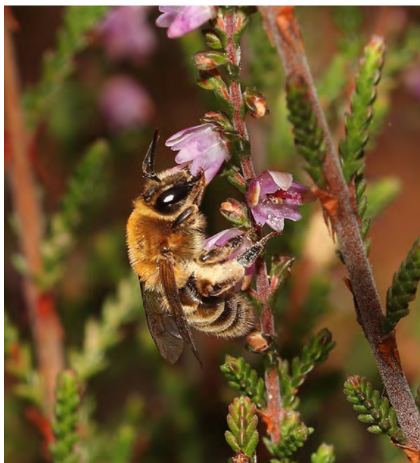
Figuur 3. Een vrouwtje heidezandbij Andrena fuscipes , een soort die sterk negatief geassocieerd is met bebouwde omgeving. Typisch is het ondergronds nestelen in de bodem tussen de waardplant, het op struikheide gespecialiseerde bloembezoek, en met de heidewespbij Nomada rufipes als koekoeksbij.

18 (Fig. 2) (tegenover respectievelijk 98 en 42 soorten met een significant negatieve associatie). Dit verschil is waarschijnlijk te wijten aan de verschillen in methodiek, en dan met name de ruimtelijke resolutie, en de databank. Belangrijker is dat in beide regio's er heel wat meer soorten negatief geassocieerd zijn met bebouwing, waarbij de eerste categorie slechts 36% respectievelijk 43% uitmaakt van de tweede. Terwijl er dus verschillende bijensoorten zijn die profiteren van bebouwing, tenminste wat hun verspreiding betreft, zijn er heel wat meer die er negatief door beïnvloed