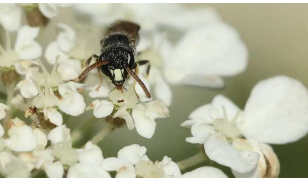
Figuur 1. Stadsmaskerbij Hylaenus punctatus , juli 2020 Schaarbeek.

Bebouwd gebied blijkt een geschikte leefomgeving te vormen voor heel wat bijen. Zo werden in 13 stedelijke omgevingen in Nederland 48-154 soorten wilde bijen aangetroffen (Peeters & Smit 2021). In Vlaanderen is dat niet anders. In de stad Leuven (Vlaams-Brabant) bijvoorbeeld werden tijdens een inventarisatie 109 soorten aangetroffen (D'Haeseleer 2014). Heel wat bijen worden genoemd als typisch voor de bebouwde omgeving op basis van een expertoordeel (o.a. Raemakers 2001, Peeters et al. 2012, Jacobs & Raemakers 2016). De laatste jaren worden zelfs nieuwe soorten voor de Belgische en Nederlandse fauna voor het eerst gemeld uit bebouwd gebied. De luzernebehangersbij Megachile rotundata en de stadsmaskerbij Hylaenus punctatus (Fig. 1) hebben zich ondertussen in Vlaanderen (incl. Brussel) stevig gevestigd (De Grave & De Rycke 2015, D'Haeseleer 2016, zie ook waarnemingen.be). In 2019 werden ook de zwartpootwolvbij Anthidium septemspinosum (Zeegers 2019, waarneming.nl) en de geelschouderwolvbij A. florentinum (waarnemingen.be) toegevoegd aan dit