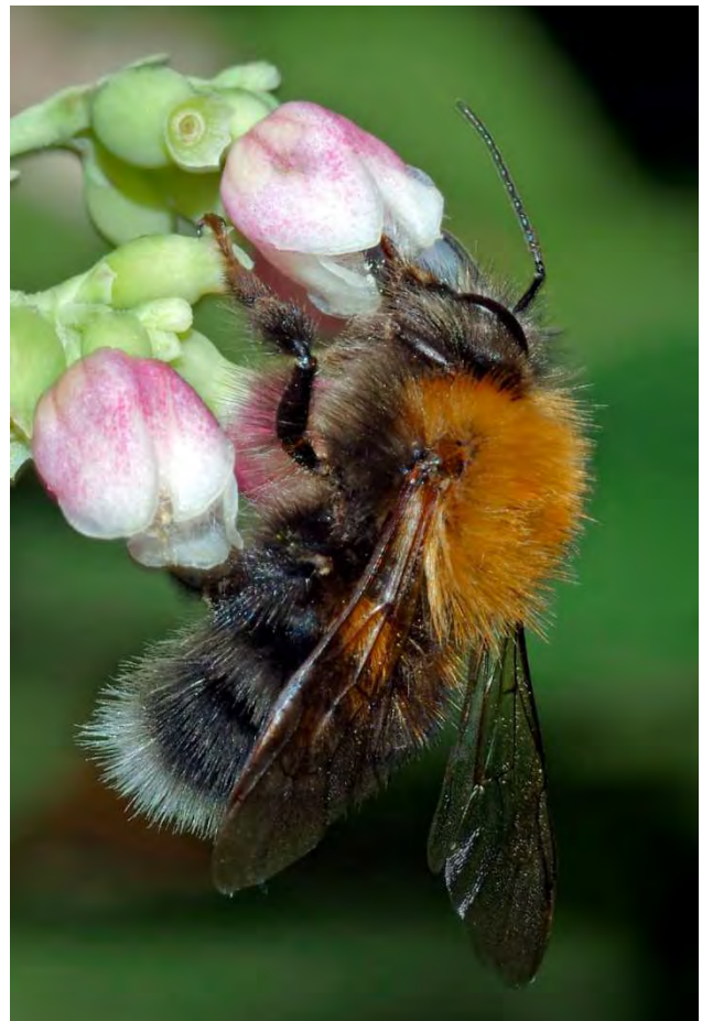
Figuur 3. Boomhommelm, Bombus hypnorum .

Omdat boomhommels defensief reageren bij trillingen of als men te dicht voor het nest gaat staan, is het belangrijk dat de locatie van het nest slim gekozen wordt. Kies daarvoor een plek aan een muur, schutting of boom die trillingvrij is en waar in principe niemand dichterbij hoeft te komen. Ook heeft het de voorkeur om het kastje op een plek in de half schaduw te hangen. Dus niet in de volle zon in verband met het gevaar op oververhitting in de zomer. Verder is er altijd kans dat, de in vrijwel elke tuin aanwezige zwarte wegmieren Lasius niger , na verloop van tijd op de honing in het nest afkomen en een legertje op de been brengen waarmee ze het hommelnest proberen te plunderen. Dus let bij het kiezen van een geschikte plek ook op of er op de grond eronder geen mierenactiviteit is om een mogelijke tragedie in de zomer te voorkomen. Als er eenmaal een goede plek is bepaald, kun je de vogelnestkast vullen met nestmateriaal. Als er toevallig al een oud mezen- of mussennest in zit is dat prima geschikt en hoeft je verder niks te doen. Als de kast leeg is, moet je zelf nestmateriaal toevoegen. Je kunt