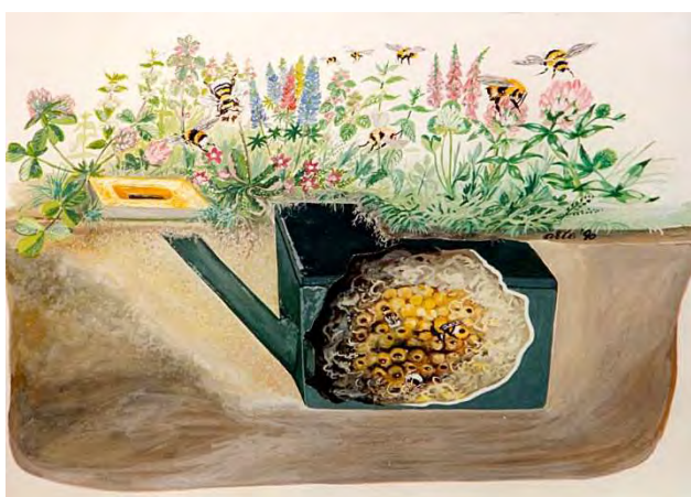
Figuur 5. Schwegler Hummelnestkasten unterirdisch.

en beschut staan. Een rustig plekje in de tuin dat 's morgens door de zon wordt beschenen en 's middags niet in de felle zon staat, is ideaal. Belangrijk is verder dat de ingang van de kast goed contrasteert tegen de achtergrond. De ingang van de kast moet er van veraf dus uitzien als een zwarte vlek tegen een lichtere achtergrond (Fig. 5). Zo wordt het gemakkelijker voor een hommelmkoningin om de nestkast te ontdekken. Zet tenslotte de kast bij voorkeur niet bij mieren nesten in de buurt. Mocht je later toch een keer merken dat mieren aanstalten maken om het hommelnest te belegeren dan kun je het kastje op een plateau zetten in een met water gevulde bak zodat er als het ware een gracht rond het nest zit. Maak die gracht echter niet te breed want ook hommels kunnen er per ongeluk in vallen en verdrinken!