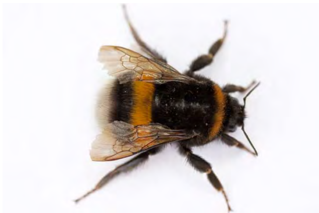
Figuur 1. Aardhommelkoningin Bombus terrestris .