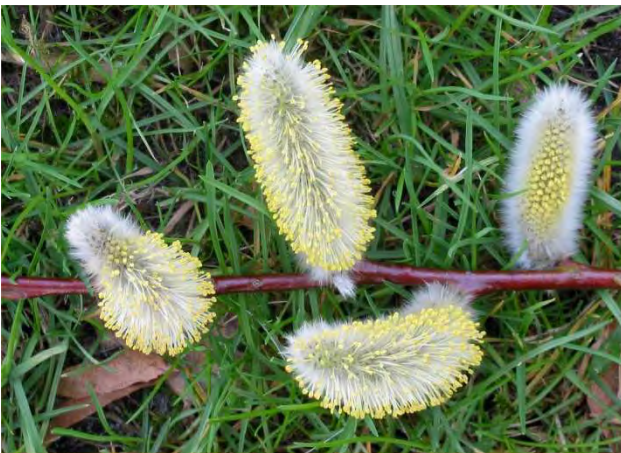
Figuur 2. Bloeiende wilgenkatjes.

Voor alle hommelssoorten geldt dat ze gebaat zijn bij een bloemrijke omgeving zodat ze het hele seizoen voldoende nectar en stuifmeel kunnen verzamelen. Je kunt de hommels (en veel andere insecten) dus een handje helpen door, voor zover nodig, je tuin in te richten met veel bloeiende planten. Voor een hommelmkoningin is het vooral fijn als er in de buurt rijke voorjaarsbloeiers zijn. Zo heb ik zelf in en rond mijn tuin een aantal wilgen (Fig. 2) en kersenbomen staan en die worden in het voorjaar altijd dankbaar bezocht door vele hommelmkoninginnen. Natuurlijk kunnen hommels vliegen en dat betekent dus dat als jouw tuin gedurende een bepaalde periode in het seizoen weinig of geen bloemen bevat maar buren verderop wel dat ze zich daar ook uitstekend mee zullen redden.