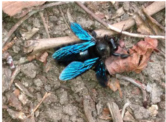
Figuur 7. Blauwzwarte houtbij Xylocopa violacea verse man op sterven.

Dat is echter wel enigszins afhankelijk van wat er in de verdere omgeving aan soorten voor komt. Wij verkeren in de gelukkige omstandigheid dat we ons bevinden in het aan bijensoorten relatief rijke rivierengebied.