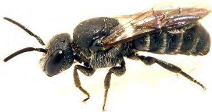
Figuur 4. Gewone tubebij Stelis breviscula .

• De gewone tubebij (rode lijst: kwetsbaar) zien we elk jaar in aantal op de bloemen en bij de bijenhôtels (Fig. 4). Daarin nestelt hun gastheer, de tronkenbij Heriades truncorum . De tronkenbij komt zeer veelvuldig voor in onze tuin, dankzij de bijenhôtels en de aanwezigheid van gele composieten. Daarop halen ze het stuifmeel om de broedcellen mee te bevoorraden.