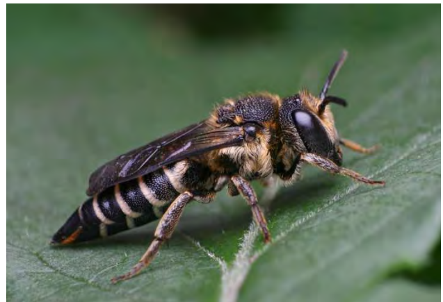
Figuur 5. Gouden kegelbij Coelioxys aurolimbata .

• De geelgerande tubebij is jaarlijks met meer exemplaren te zien in onze tuin. Van de waarschijnlijke gastheren zijn er twee soorten die in onze tuin voorkomen: de zwartbronzen metselbij (2 x waargenomen) en de grote wolbij. Deze laatste is elk jaar in de tuin aanwezig, zodat het aannemelijk lijkt dat dit hier de gastheer is.