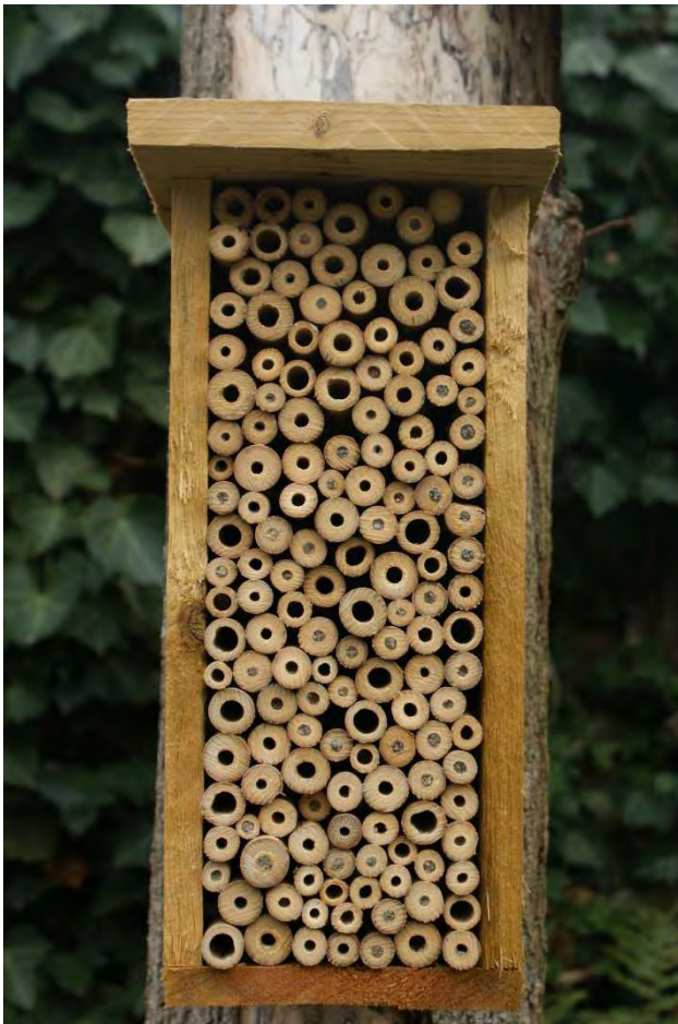
Figuur 3. Zelf gemaakt bijenhotel.