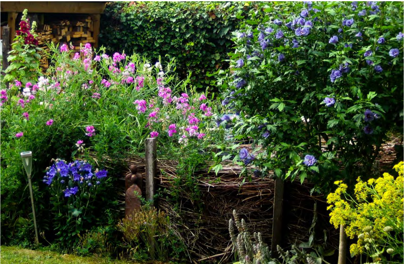
Figuur 2. Deel van de achtertuin met inheemse planten; brede lathyrus, jacobskruid, klimop en uitheemse planten; campanula sp., hibiscus, stokroos.

De achtertuin bevat eveneens een mix van inheemse en uitheemse plantensoorten (Fig. 2). Sommige uitheemse soorten worden druk bezocht door honingbijen en hommels, zoals Bulgaarse ui, citroenmelisse, clematis, fuchsia en hibiscus. Voor de wilde bijen staat ook hier een aantal plantensoorten dat erg aantrekkelijk is: aardaker, bergsteentijm, betonie, brede lathyrus, donkere ooievaarsbek, Engelse alant, gele dovenetel, jacobskruid, judaspenning, klimop, longkruid, ruig klokje, venkel, vingerhoedskruid en Zeeuws knoopje. In het grasveldje staan witte klaver, madelief en paardenbloem.