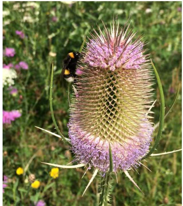
Figuur 1. Aardhommel op grote kaardebol.

van blad, wol en klei. Van het bijna magische proces van synchroniciteit, waarbij de bij op exact hetzelfde moment uitvliegt als dat de waardplant tot bloei komt, ondanks meteorologische variatie. En van de fascinerende relatie tussen bijen en planten, waarbij de plant de bij als een gulle waard verwelkomt met landingsbanen op het blad en routekaarten naar de nectar.