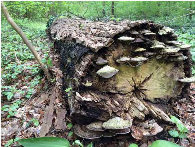
Figuur 4. Dood hout leeft.

haar eitjes af in dode boomstammen (ah, vandaar die naam) terwijl maskerbijen de voorkeur hebben voor holle stengels van braam of vlier. Door riet, ruigte en graslanden altijd gefaseerd te maaien, blijven er nestplekken behouden. Ook is het poëtische uitgangspunt “dood hout leeft” reeds een leidend principe binnen het beheer van onze bossen en bosplantsoenen, ook in stadsparken als het Vondelpark of Flevopark. Dode bomen worden niet meer automatisch verhakseld zoals dat voorheen gebeurde, maar mogen als herders van het landschap de parken sieren (Fig. 4).