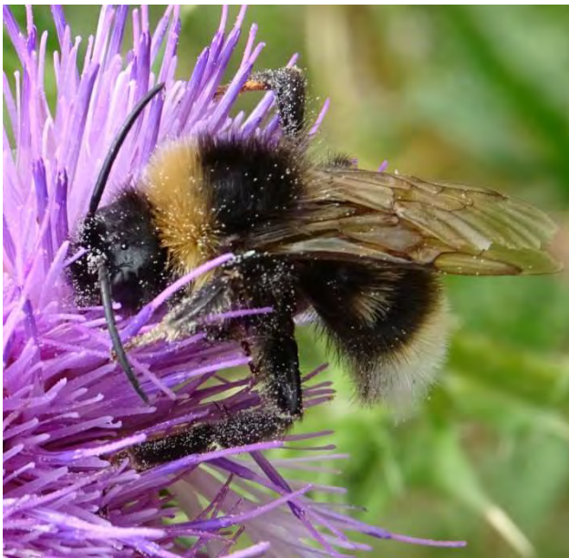
Figuur 3. Grote koekoekshommel Bombus vestalis .

aantal was, schudden Reemer en collega's met gemak 50 bijensoorten in één gebied uit hun mouw. In totaal heeft EIS in 2019 en 2020 in de onderzochte gebieden in Amsterdam 104 soorten waargenomen. Nog niet alle locaties zijn reeds onderzocht, die volgen in 2021. Verschil in methodiek kan een rol spelen in het wederom sterk gestegen totaal aantal bijensoorten. Maar ook hier zaten weer rode lijstsoorten (Reemer 2018) bij, zoals de weidebij Andrena gravida , bruine rouwbij Melecta albifrons , roodsprietwesp bij Nomada fulvicornis , rietmaskerbij Hylaeus pectoralis , weidemaskerbij Hylaeus gibbus , kleine tuinmaskerbij Hylaeus pictipes en grote koekoekshommel Bombus vestalis (Fig. 3).