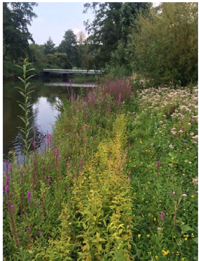
Figuur 5. Recent aangelegde natuurvriendelijke oever in het Gijsbrecht van Aemstelpark, met grote wederik (geel) en grote kattenstaart (paars).

Een ander thema dat naar boven komt als we het groen door de ogen van de wilde bijen bekijken, is variatie in voedsel. De meeste wilde bijensoorten zijn voor hun voedselvoorziening niet kieskeurig: als een plant nectar (energiebron) en stuifmeel (eiwitbron) geeft, voldoet het al snel. Maar tientallen bijen zijn voor hun stuifmeelbehoefte gespecialiseerd op een enkele plantenfamilie (de oligolectische bijen) of soms zelfs op een enkele plantensoort (de monolectische bijen). Binnen het beheer is het van belang dat er oog is voor deze specifieke plantensoorten en de daaraan correlerende bijensoorten. In Amsterdam is hier binnen een aantal projecten aandacht voor geweest. Zo was bij het aanleggen van een halve kilometer natuurvriendelijke oever in het Gijsbrecht van Aemstelpark de gewone slobkousbij de doelsoort.