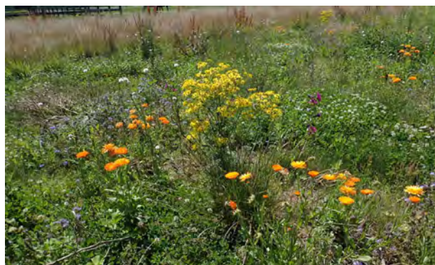
Figuur 2. Berm in Breda.

bermmaaisel wordt overal steeds afgevoerd. Dit maakt de bermen op den duur voedselarmer. Grassen groeien daardoor minder hoog en dicht, waardoor andere planten meer kans krijgen om te kiemen en tot bloei te komen. De bermen worden dus door dit verschrallen soortenrijker en bloemrijker.