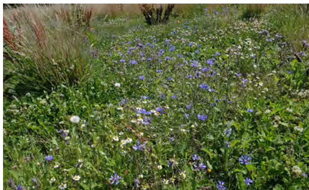
Figuur 1. Berm in Breda.

Meer dan 90% van de oppervlakte van de bermen wordt één of twee keer per jaar gemaaid. Het