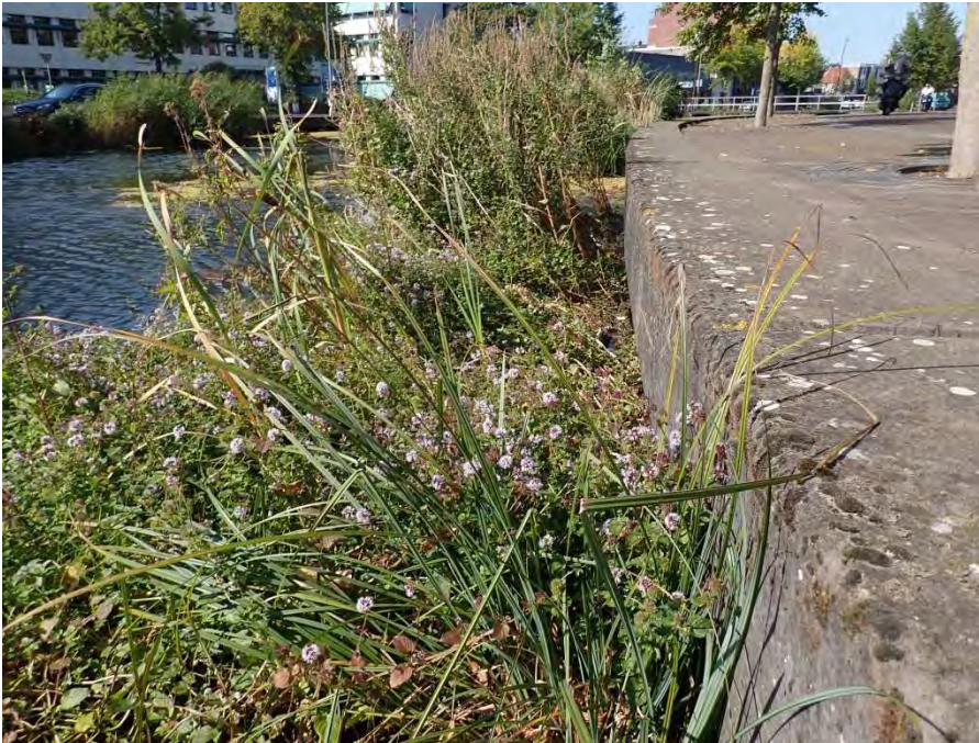
Figuur 3. Natuurvriendelijke oever met munt.

tot het laten staan van zogenaamde vlinderstroken. Ongeveer een vijfde van het oppervlak van deze bermen - ieder jaar een ander stuk - wordt dan niet mee gemaaid om eitjes, rupsen en poppen van vlinders meer overwinteringsmogelijkheden te geven. Dit gebeurt dit jaar op een tiental plekken in de stad. Daarnaast worden er her en der kale plekken aangebracht met alleen zand. Dit wordt speciaal gedaan voor de gravende insecten, waaronder de graafbijen- en wespen.