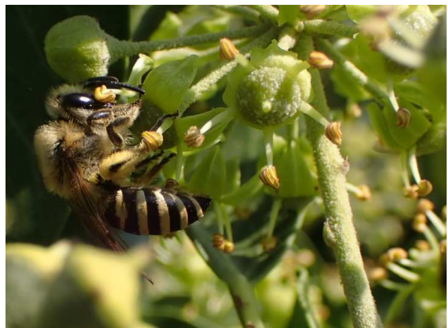
... en met klimopbij.

In 2018 heeft de gemeente een nulmeting door het bureau Ecologica laten uitvoeren naar bijen: 'Monitoring wilde bijen Breda'. Het gaat daarbij om 16 gemeentelijke locaties. In de monitoring zijn 104 soorten bijen aangetroffen. In de database van Nederland Zoemt vindt men 118, deels overlappende soorten. In totaal zijn er 148 soorten uit Breda bekend. Dat is veel. De meest bijzondere soorten zijn: de